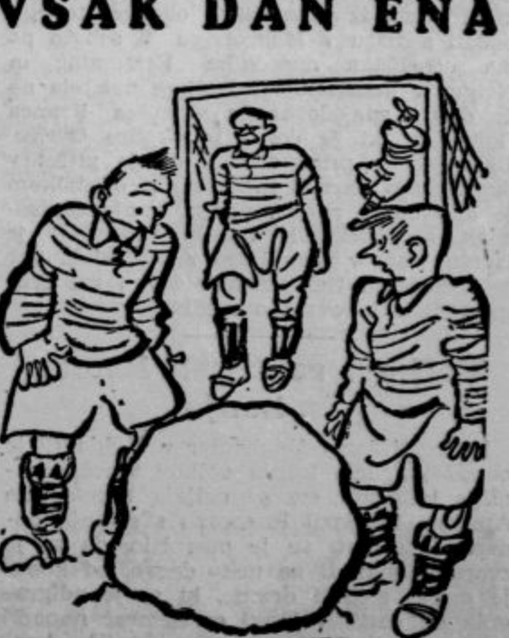
»Kaj s takšno žogo bomo nadaljevali igro?« (Politikens)