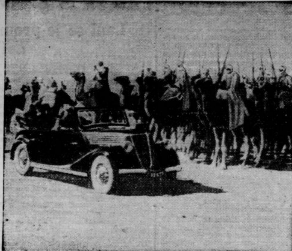
Pri Daladierovem obisku v Tunisu je bila velika vojaška parada, na kateri so zbužali posebno pozornost jezdec na kamelah