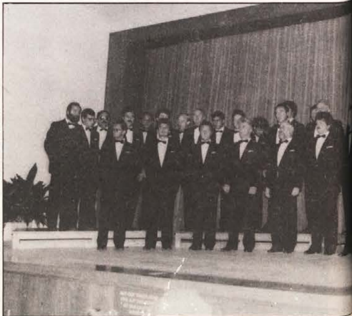
V velikovski Neue Burg je zadonela slovenska pesem – začel

Zur Aussage, wonach in Zukunft bei allen anstehenden Problemen der breitestmögliche politische Konsens erreicht werden soll, sagte Sturm, daß ein derartiger Konsens auch von der slowenischen Volksgruppe gewünscht werde. „Einen Konsens mit den deutschnationalen Kräften, der sich gegen die Interessen der Volksgruppe richtet, wie etwa in der Schulfrage, lehnt der Zentralverband ab; heißt es abschließend in der Erklärung des Sekretärs des Zentralverbandes.