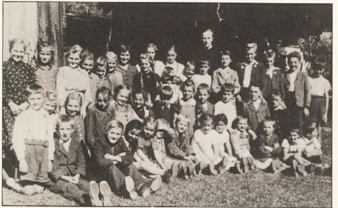
Na sliki iz leta 1948, ki so jo posneli 4. oktobra, je 41 učencev nekdanje lepenske šole.

Slovensko ljudsko gledališče iz Celja je v petek na domačem odru z velikim uspehom zaigralo premiero igre „Opera za tri groše“, ki jo je napisal Bertold Brecht, glasbo pa je komponiral Kurt Weill. „Opera za tri groše“ je po vsebini in svojih težnjah pravi Brechtov „otrok“. Vsak posamezen prizor zrcali njegovo močno zavzetost za socialno pravičnost in ostro družbeno kritiko. In ni slučajno, da je prav to delo ob začetku tega stoletja prvič privabilo v gledališče tudi revnejše sloje. Celjsko gledališče pa bo z „Opero za tri groše“ ali „Beraško opero“ gostovalo tudi na Koroškem in sicer 15.10. v kulturnem domu v Ločah, dan za tem pa v Kulturnem domu v Šentprimozu. Prireditelji so okoliška in domači prosvetni društvi ter SPZ!