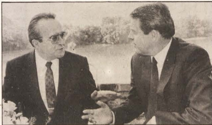
Predsednik jugoslovanskega Zveznega izvršnega sveta Branko Mikulić v razgovoru z avstrijskim zveznim kanclerjem Vranitzkim.

Bliža se odhod bralcev Sloven- skega vestnika na tridnevni VESTNI- KOV HIT '88. Lepo jensko vreme nam obeta prijetno biva- nje na istrski obali. Podrobnejše infor- macije o odhodu avtobusov v petek in soboto na 7. strani.