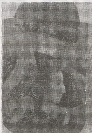
Detajl ene od razstavljenih slik