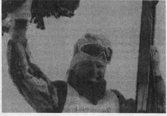
Manuela Di Centa, zlata kolajna v Lillehammerju

Olimpijske igre na Norveškem so se začele pod vtisom bratomorne vojne v Bosni in ob spominu na sarajevske olimpijske igre. V znak žalovanja za številne preminule civiliste, so se na