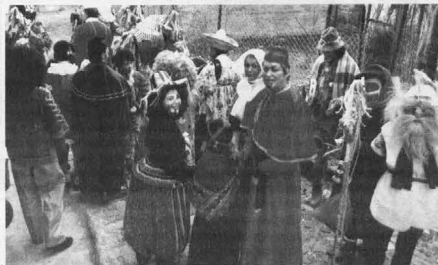
An par fotografij od pusta 1994 v Sriednjem an v Carnem varhu

Bluo je marzlo, Carnovaršanj pa so zaries topli judje an imajo veliko sarce.