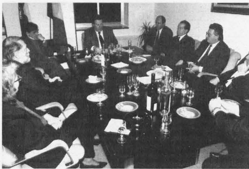
Spetski zupan Marinig s kolegi iz Nove Gorice, Tolmina in Skofje Loke