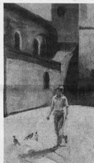
V luči, detajl