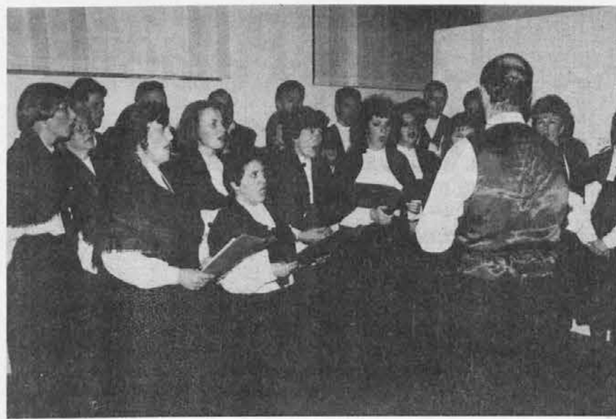
Pevski zbor Pod lipo v Beneški galeriji in pogled na publiko v občinski dvorani v Spetru

C'è però un altro versante dove gli enti locali sono latitanti ed è quello della rinascita culturale che è condizione necessaria, anche se non sufficiente, per il rilancio economico. Bisogna creare un clima favorevole perché i giovani siano incoraggiati a proseguire gli studi anche a livello universitario, individuando gli strumenti operativi per sostenere questa politica ed aumentare il nostro potenziale intellettuale. Altrimenti anche i più sostanziosi interventi esterni non ci faranno uscire dall'emarginazione e non saremo in grado di cogliere le opportunità che oggi si presentano alla nostra area di confine. Sentiamo ripetere che non siamo più ai margini, bensì al centro della nuova Europa. Ebbene dobbiamo essere consapevoli che ciò dipende dalla nostra capacità di essere protagonisti.