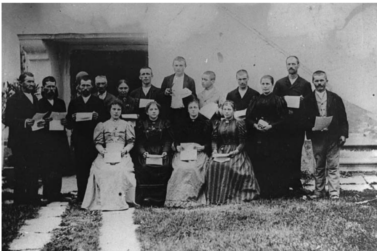
Mešani pevski zbor iz Biljane v Goriških brdih leta 1896 (Dokumentacija Oddelka za etnologijo in kulturno antropologijo Filozofske fakultete v Ljubljani)

tudi avtentizirane ljudske glasbene umetnosti v zgoraj naštetih strukturah. Bésede so bile družabne prireditve z govori, deklamacijami, gledališkimi scenami in seveda glasbo, s posebnim poudarkom na petju. Društva in čitalnice so jih pripravljali ob zelo različnih priložnostih, kot so bile razne obletnice, občasno so prirejali tudi dobrodelne bésede . 48 Poročila o bésedah v organizaciji različnih čitalnic lahko najdemo skoraj v vsaki izdaji takratnega časopisa.