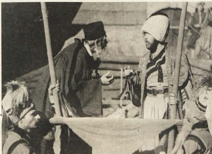
Tresoglav terja svoje plačilo za izdajo.