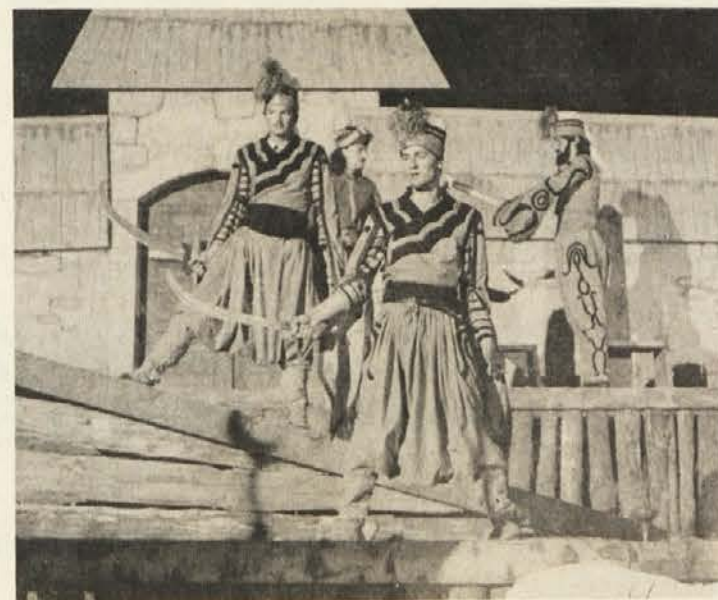
Turški premoči kmetje niso kos.