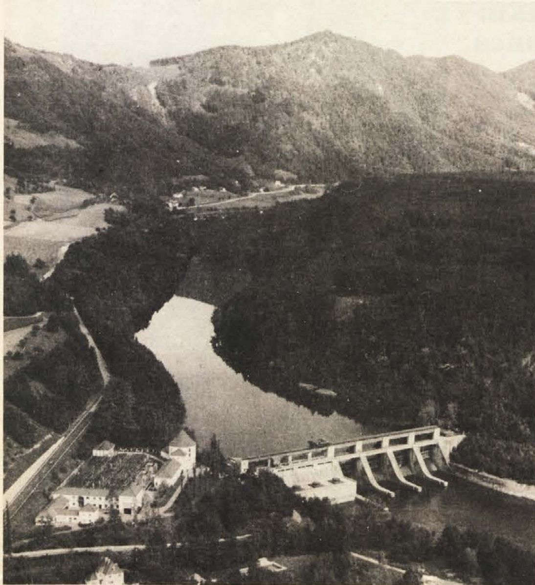
Že 40 let vzdržujejo Avstrijske dravske elektrarne (ÖDK) elektrarno v Žvabeku. Ta je ena izmed devetih, ki so jih zgradili ob Dravi. Vsa gradbišča so že spet zelena. Jez v Žvabeku sodi med najlepša prirodna okolja dežele.