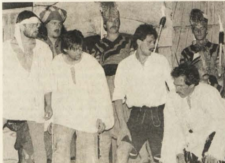
Slovenski kmetje v turških verigah.