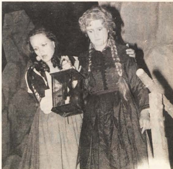
Almiri spodleti nakana – Miklove Zale ne more potisniti v prepad.

Zato svinčnike in peresa v roke in sodelujte z nami.