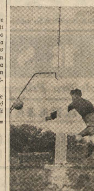
GOL! PRESENECENI VRATAR SESLJANA.

Tržačani zmagovalci v košarki Ljubljancani pa v odbojki V košarki so se vse tri tekme končale z zmago Tržaškega košarkarskega kluba, dijakov in dijakinij - Sv. Ivan pa je v odbojki izgubil proti močnim Ljubljancanom