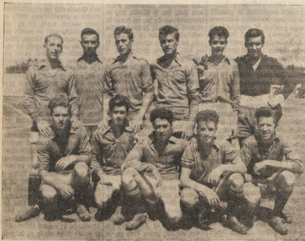
NOGOMETNA ENAJSTORICA NABREŽINE - PRVA NA LESTVICI.

Neodločen izid tekme med Prosekom in Opčinami - Kontovel zaslužno premagal Sesljan - Nabrežina si je zaslužila dve točki brez borbe