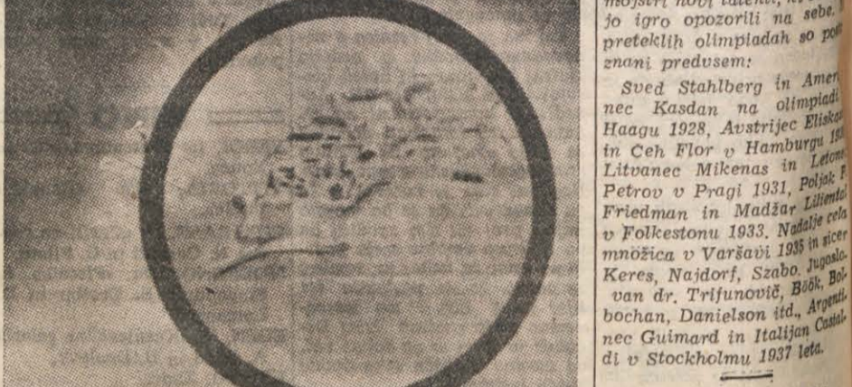
LEPAK ŠAHOVSKA OLIMPIADE.

Za IX. olimpiado, ki se začne 20. t. m. v Dubrovniku, se je do sedaj prijaviło že 18 držav. Pričakujejo pa še prijave od Švedske, ki je sodelovala do sedaj že na vseh olimpiadah, in Meksike. Na predoljnih olimpiadah je igralo: v Londonu 16 držav, v Haagu 17, v Hamburgu 18, v Vrook je bila dolga in draga pot v Evropo. Na drugi strani pa imamo Poljsko, Češkoslovaško, Madžarsko, Romunijo in Bolgavijo, ki zaradi diskriminacijske politike njihovih vlad do Jugoslavije, ne bodo sodelovale na olimpiadi v Dubrovniku. Po-