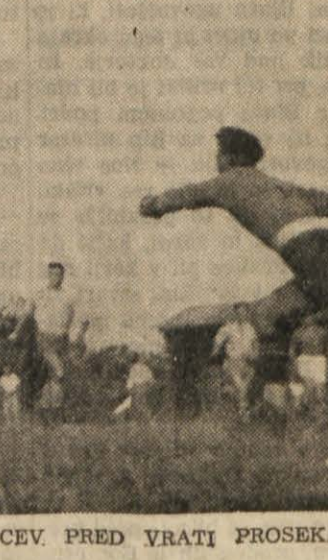
NEVAREN NAPAD OPENCEV PRED VRATI PROSEKA.

Poleg tega je izvršni odbor Nogometne zveze Jugoslavije