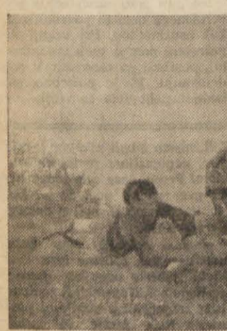
VRATAR SESLJANA ROLLO V AKCIJI.

Kakor smo že predvidevali je bila tekma med Prosekom in Opčinami res ostra in borbena. Openci so hoteli na vsak način oprati sramoto preteklega nedelja in se jim je delno tudi posrečilo. Z majhno spremembo v postavi so Openci tebojšali igro in postali bolj nevarni.