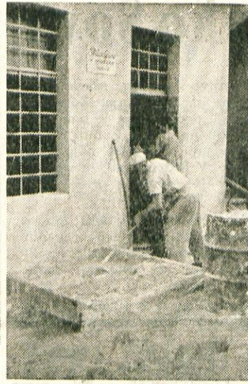
Tudi Mesarsko podjetje ima težave zaradi prostorov. Da bi pa povečali proizvodnjo brez večjih stroškov in novogradenj so mesarji sklenili, da bodo pomagali pri rekonstrukcijskih delih s prostovoljnimi delom. Na slikah jih vidimo pri delu v nedeljo, 19. junija