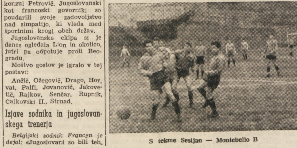
S tekme Sesljan - Montebello B