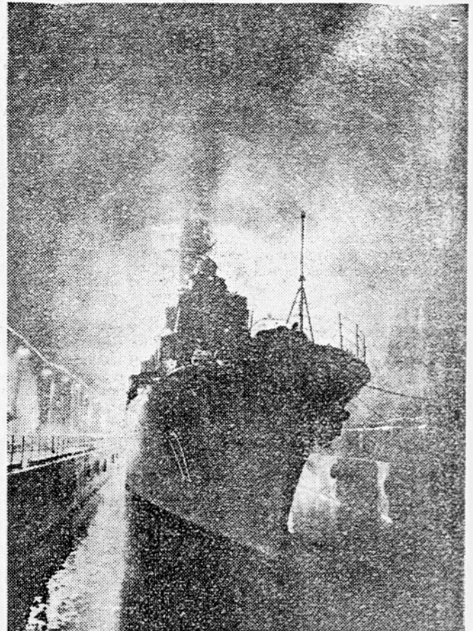
Kljub njeni nevtralnosti je znano, da ima Švedska eno izmed najmodernejših armad na svetu. Tudi mornarica ni majhna, kar je pa še več vredno, je to, da je zelo sodobna. Pred kratkim so švedske oblasti izdale javnosti še eno tajnost. Ob vsem Baltiku so napravili v skalnata obrežja posebne tunele, kjer lahko pristajajo tudi največje vojne ladje. Na sliki vidimo švedskega rusilca »Upplanda« (830 ton) zasidranega v podzemskem pristanišču. Ta pristanišče, so vama pred bombardiranjem, obenem pa se na ta način lahko dobro skrije razmeroma velika flota