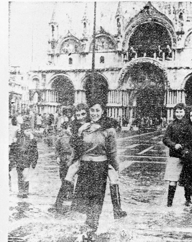
Nedavno so hudi nativi povzročili pravo poplavo v Benetkah. Na sliki vidimo Benetčane na poplavljenem Markovem trgu