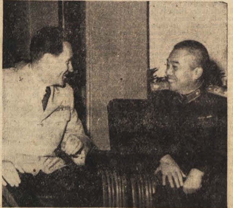
Generalpolkovnik Kosta Nagy pri kitajskem obrambnem ministru Peng Te Hvajju

Po pogajanjih z Albanijo se bodo začela bržkone sredi oktobra tudi pogajanja z CSR za podoban sporazum.