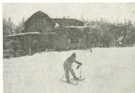
Prvi koraki na snegu

ne ne zahteva ničesar drugega kot izpisek iz rojstne matične knjige; rad bi namreč črno na belem, da je naš občan.