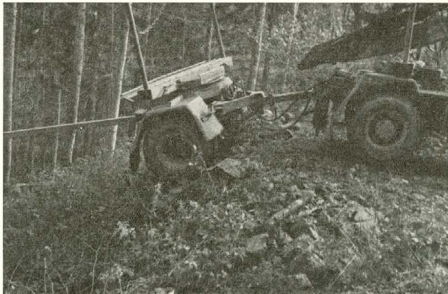
Pri takšnem obračanju ne trpi samo priklop, ampak tudi šofer