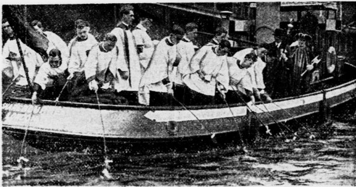
Cerkvena občina župnije Sv. Dunstana v Londonu še dandanes goji staro šego, da vsako leto s šibami udarja in označuje mejo cerkvenega območja. Ker pa teče meja deloma preko Tenze, se duhovni s celonom popeljuje preko nje in z dolgimi šibami pretepajo vodo. Tej velesvečani ceremoniji prisotvuje vedno tudi zastopnik londonskega magistrata.