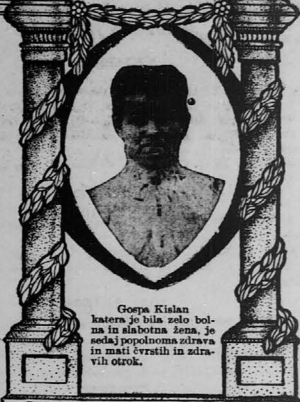
Gospa Kulan katera je bila zelo bolna in slabotna žena, je sedaj popolnoma zdrava in mati čvrstih in zdravih otrok.

Poslijte še danes za 15 centov poštnih znamk za prekoristno knjigo "Človek, njegovo življenje in zdravje" Vsaka slovenska družina bi jo mogla imeti.