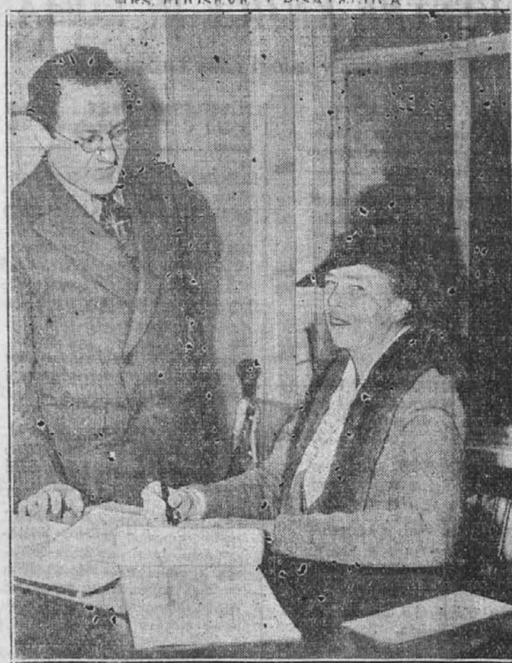
Soprega predsednika Roosevelta se poieg svojih mnogih opravil kot "first lady" obsežno bavi tudi s pisateljevanjem. Gornja slika jo kaže, ko je podpisala pogodbo z neko časniško družbo za dnevne članke v listih.

Brat Veselko božji muzikant bo lažje zlezal skozi vrata večnosti kakor Jeremija Žalostnik, ki misli, da ima patent na božje srce, pa pozablja, da je vsa njegova popolnost le navlaka, ki ga na poti do Boga le ovira.