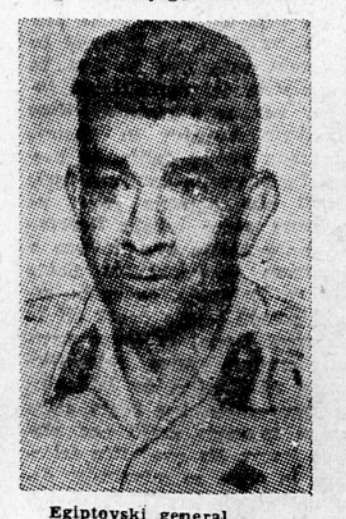
Egiptovski general Mohamed Nagib

Toda borci in aktivisti Dolomitskega odreda ne mislijo proslavo obkrožiti zgolj s proslavo samo, temveč pripravljajo Toškemu čelu tudi prijetno presenečenje. Toško čelo je sicer že dlje časa obnovljeno, vendar pa je še vedno brez elektrike in prav nalogo, da bodo v okviru svoje proslave na Toško čelo speljali električni tok, so borci Dolomitskega odreda pravezeli nase iz hvalečnosti za gostoljubnost, ki so jo uživali v tem kraju v najtežjih časih.