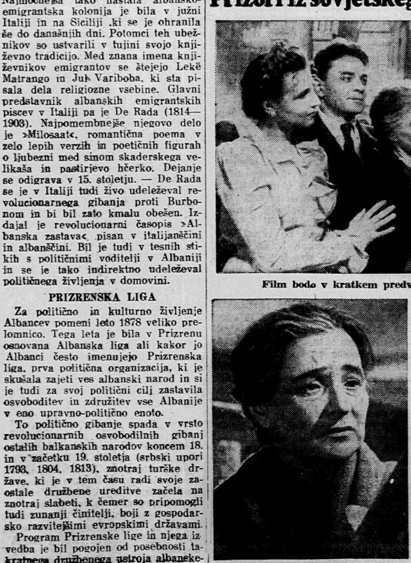
Film bodo v kratkem predvajali v naših kinematografih