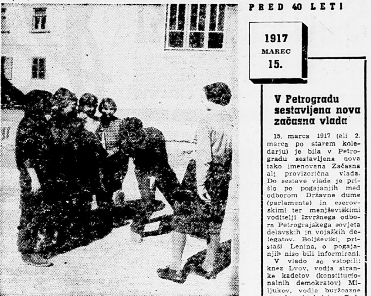
PRED 40 LETI 1917 MAREC 15.

Po prvem letu je nastal zastoj. Hišni svetli so izkoristili vse možnosti, da čim hitreje popravijo zamujeno. Toda s tem so si za daljšo bodočnost odvzeli vsako možnost gospodarjenja. Odplačila najetih posil so izpila del nazaj, kar je privedlo do izčrpanosti. Ker ni bilo s čim gospodariti, je začel tudi padati interes stanovanjcev za delo v hišnih svetlih. Posledično je prišlo do tega, da se nezadovoljni med današnjimi najemniki in cenami gradbenih in obrtniških storitev. Zato se tudi s tega gledišča vedno bolj postavljajo vprašanja uvedbe stvarne najemnine, ki naj bo v skladu z dejanskimi stroški stanovanja. Čim prej bomo rešili ta problem, tem prej bomo pomagali nadležni stanovanjski skladom in omo-