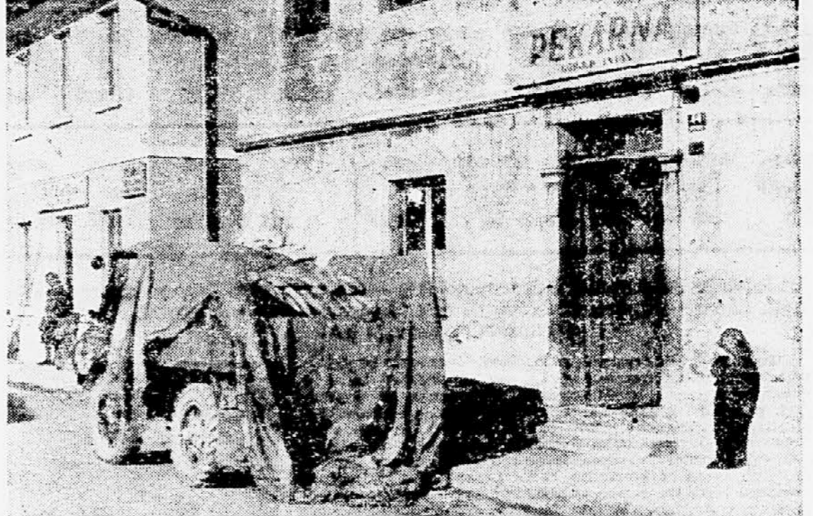
Gornjo sliko je posnel naš fotoreporter v sredo, 13. marca v Cerknici. Okrog 9.45 je stal pred pekarno kakih 20 minut s kruhom napolnjen Unimog, ne da bi ga prekrili s platio, ki je ležala kar na tleh.