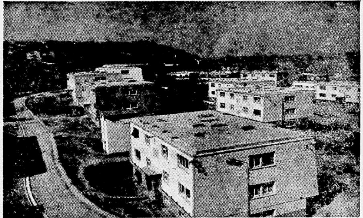
Pogled na del novega naselja v Semečeli pri Kopru, kjer je zrasla vrsta ličnih, v glavnem petstanovanskih blokov. Koper je s tem zelo mnogo pridobil, tako pri reševanju stanovaljske stiske kot v estetskem pogledu.