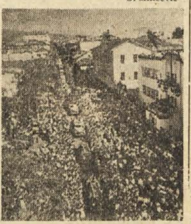
Proslava kostariške zmage v San Joséju