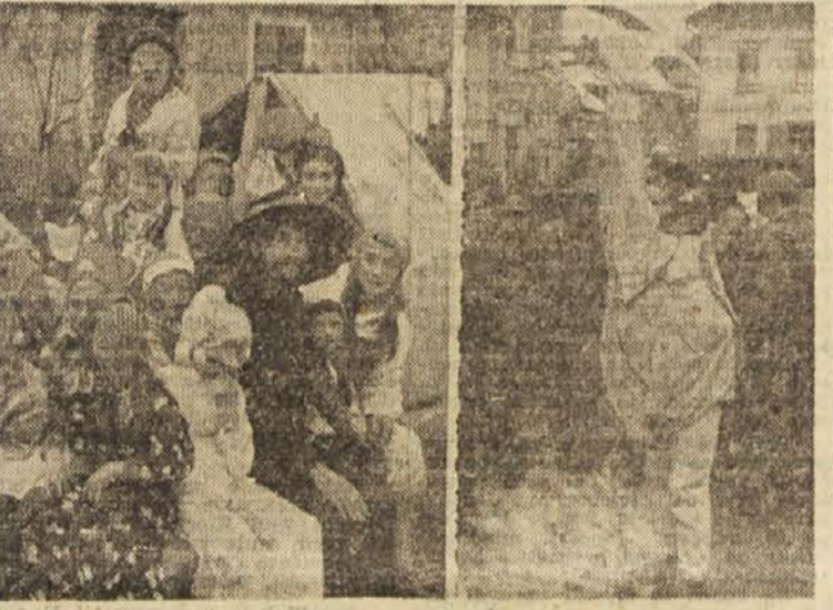
Kurenta, druge imajo spet druge stalne maske. Metlika pa ima svoje »gadje in belouške«. Tudi metliško pustovanje korenini nekje v davnini, čeprav ne v taki obliki kot ga poznajo sedanjji Metličani.

Ob Pustu je skoraj povsod velik dirndl. Če sicer ne, tega dne je marsikaj dovoljeno. To je poseben dan, ko ljudska norčija ne pozna meja. Vsak kraj ima pa svoje posebnosti. Dravsko polje ima znamenitega matorij. Metličani imajo namreč težave s pokopalščem. Pa so ga že menili, da bi bilo pametno uvesti krematorij. Druga skupina si je spet omislila letalo na reakcijski pogon. Tako je vsaka skupina pripravila