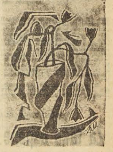
Dimče Protuger: Goblen

V rubriki »Kritike in poročila« poroča Andrej Budal o novih izsledkih o »Cedačnem evangeliju«. Številko je opremil akademski slikar Bogdan Grom.