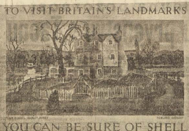
Lepak Rowlanda Suddabya, ki propagira obisk angleške pokrajine staromodnih gradov in dvorcev