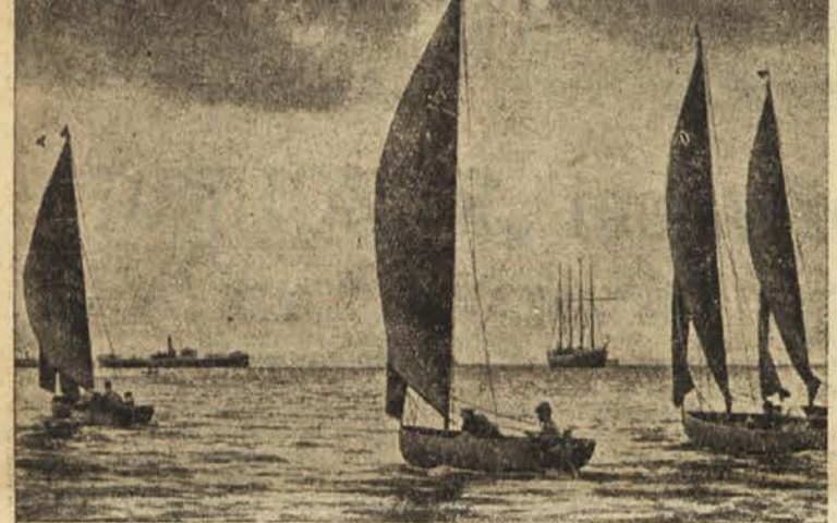
Jadralce ob koprski obali