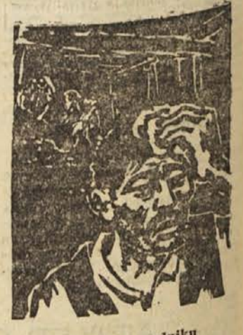
V borskem rudniku

»Bilo je tako, zdaj pa je marsikje precej drugače. Glej, jaz in moja hčerka sva danes privrkat v dolini, privrkat sva se peljali v avtobusom in privrkat se pe-z avtobusom in privrkat se pe-z ljeva z vlakom. Zdj imamo več novih cest in mnogo poti, zdi lahko prideš v poldrugi uri.«