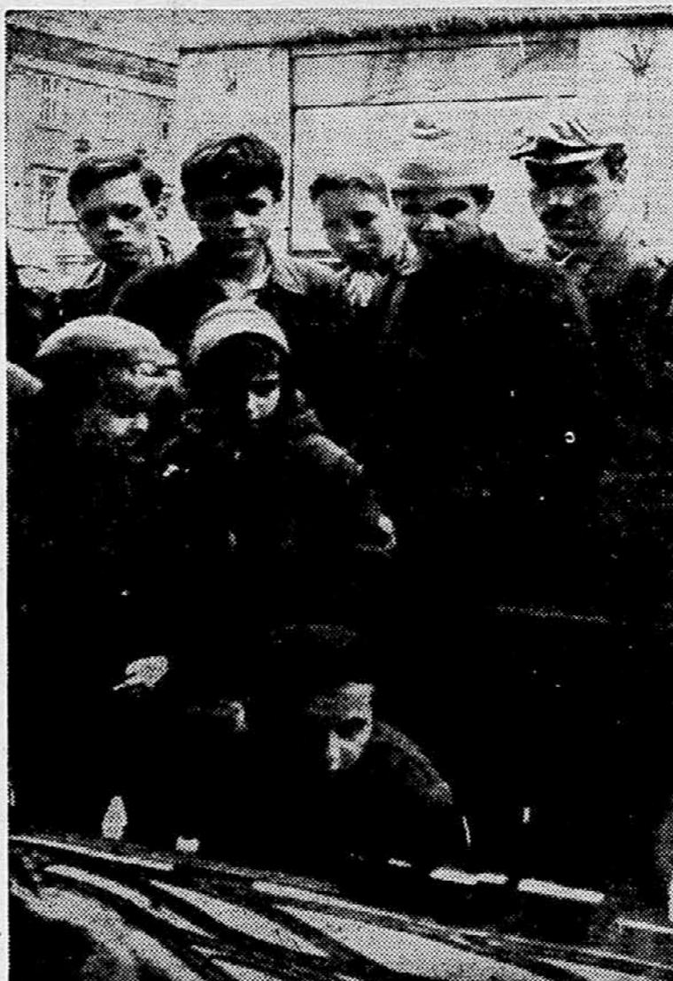
Novoletne izložbe — paša za oči naših najmlajših.

Združni svet pri kmetijski zadrugi v Kamnici šteje 31 članov. Pred kratkim se je sestel in konstituiral. Na seji so razpravljali predvsem o gospodarskem načrtu kmetijske zadruge. A. O.