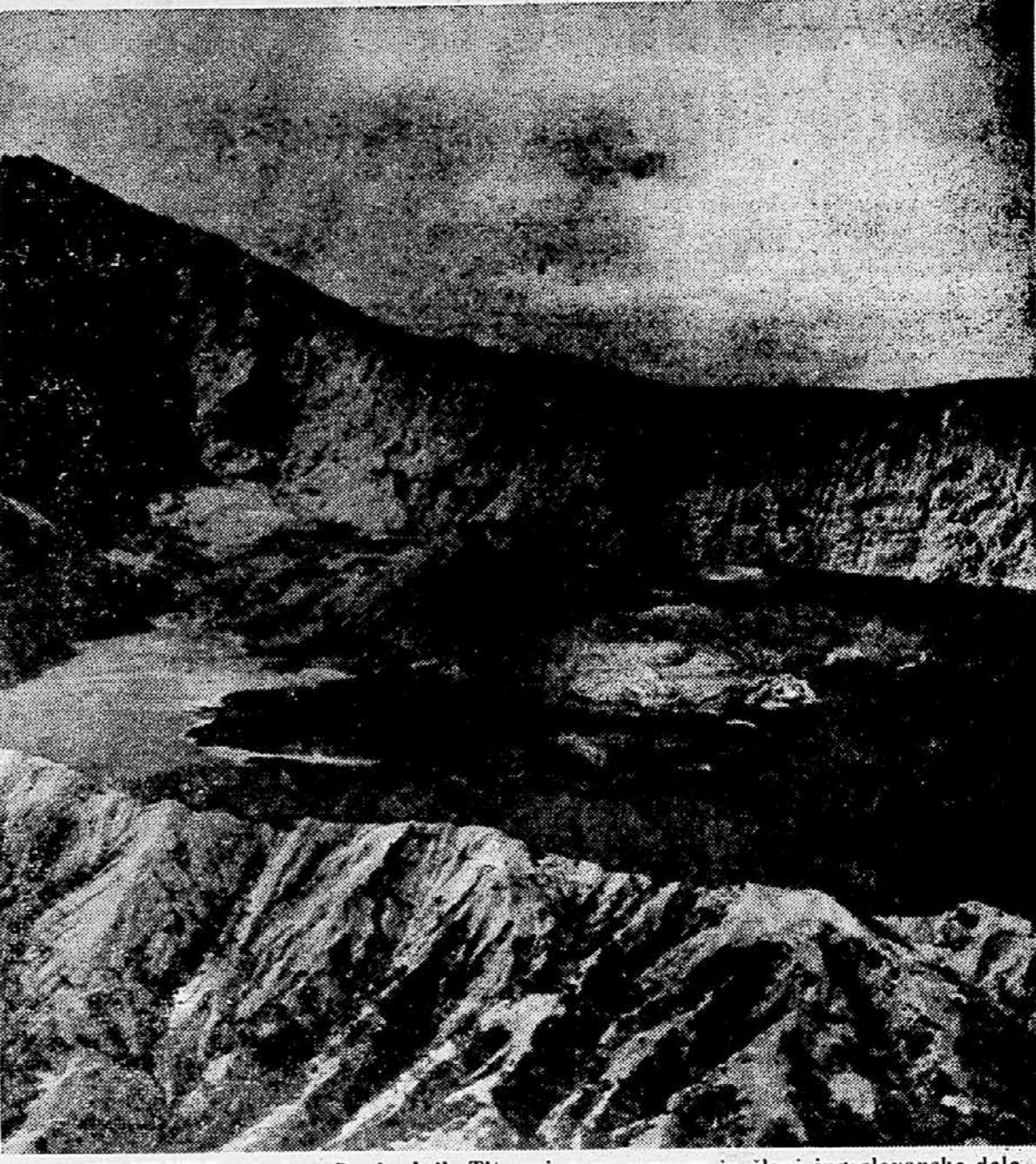
BANDUNG, 25. dec. Predsednik Tito, njegova soproga in člani jugoslovanske delegacije, predsednik Sukarno s soprogo in visoki indonezijski funkcionarji so odpotovali včeraj zjutraj ob 8.30 po lokalnem času iz Bogorja v Bandung. Vzdušje poti v celotni dolžini 120 km so visoke goste pozdravljali prebivalci. Vsa naselja, skozi katera je šla kolona avtomobilov, so bila okrašena z zastavami in transparenti. Na sliki: Na najhnejem otoku Lombok je najvišji vulkan v Indoneziji Rindjani. Visok je 3776 m. »Mali« vulkanski stožec se dviga 400 m nad vulkanskim jezerom.