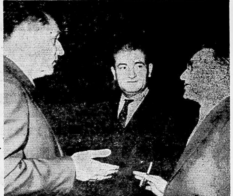
Ljudski poslanci Ivan Gošnjak, Ljupčo Arsov in Moma Marković v razgovoru med odmorom na zasедanju zvezne ljudske skupščine.

Zvezni zbor je predlog zakona o nacionalizaciji najemnih poslopij in gradbenih zemljišč soglasno sprejel.