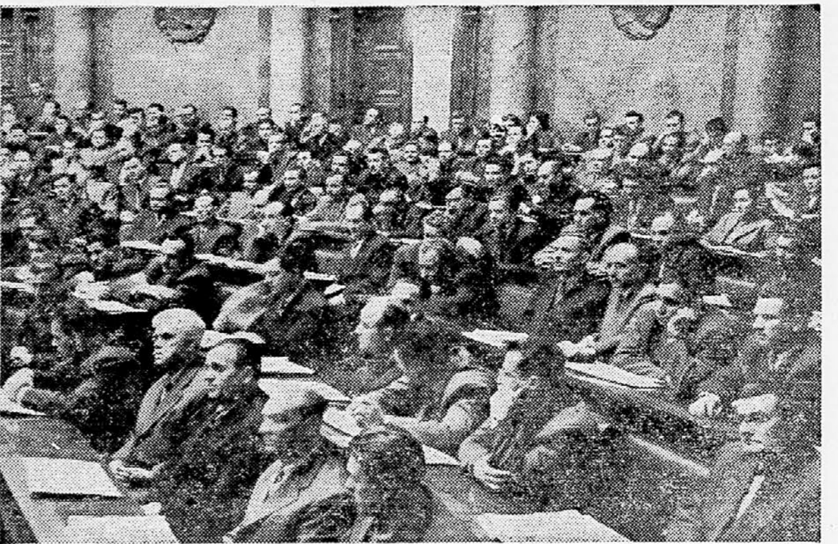
Pogled na skupščinsko dvorano med zadnjim zasedanjem v letošnjem letu

»Pojmovanje koeksistence,« je dodal predsednik Tito, »pomeni ne samo reševanje sporov na miroljuben način, temveč tudi nekaj več od tega. To zahteva vsakodnevne napore pri ustvarjanju potrebnih pogojev za postopno reševanje sporov, za razorožitev, za gospodarski in kulturni dvig, za pomoč nezadostno razvitih držav, za konstruktivno in miroljubno tekmovanje na ekonomskem, kulturnem, znanstvenem in drugih področjih. Kot tudi za dvig proizvodnih sil držav na višjo stopnjo. Ko govorimo o aktivni miroljubni ko-