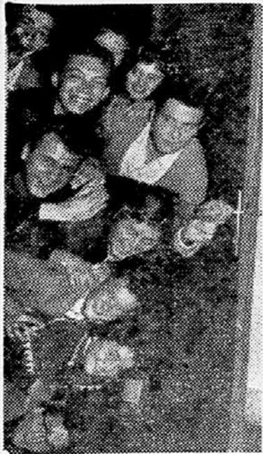
Solski odmor je na gimnaziji vsekar najbolj popularna ura. Iz noveletne številke »Tovariša«