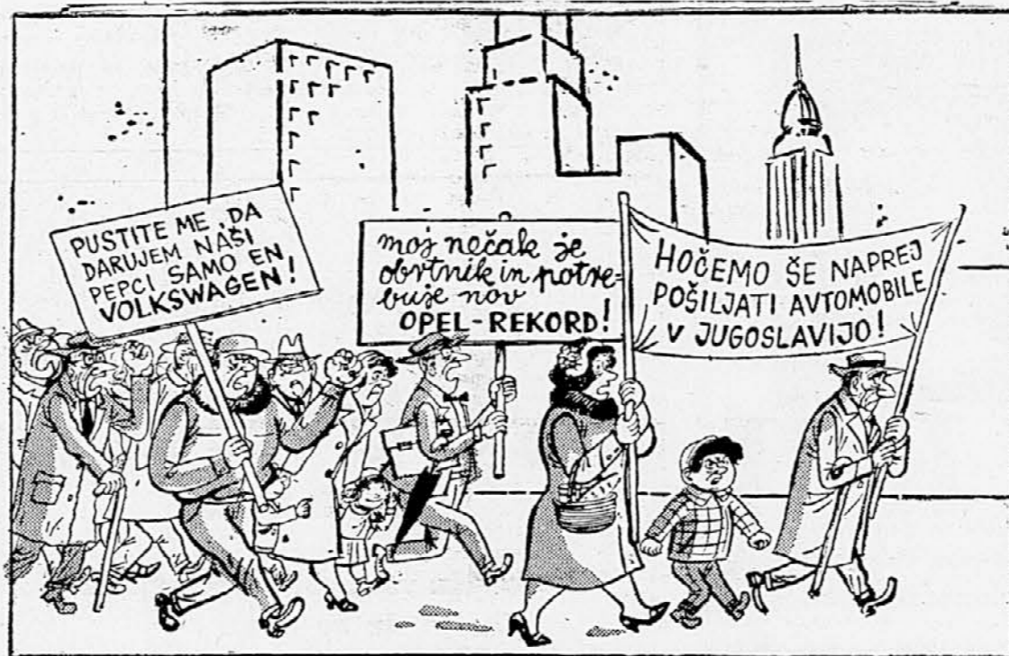
Demonstracije v tujini