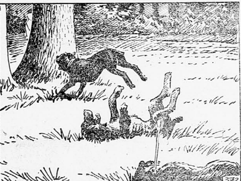
372. V istem trenutku je tudi Peter vrgel svoj ostrí kamen proti psom. Tudi on je zadel! Drugi pes se je za trenutek ustavil, potem pa klenil. Kamen ga je zadel v desno prednjo nogo in mu jo odbil, kakor da bi bila lesena. Žival je boleče zavijala in legla v travo, tretji pes pa je ves divji stekel naravnost proti mladihna napadalca.