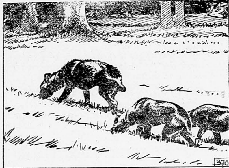
370. Ze sta zaslilašala topotanje pasjih nog po gozdnih tleh in vohljanje velikega psa. V naslednjem trenutku se je žival pognala izza grma, za njo pa oba manjša psa, ki sta velikega komaj dohajala. Glave so držali pri tleh in vohali po stopinjah. Mož ni bilo — najbrž so odvezali pse in jih spustili naprej v upanju, da bodo begunce zadržali.