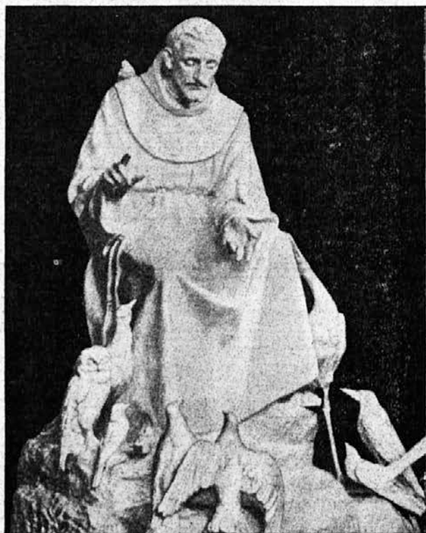
Frančišek in ptice.

Pričujoča številka »Lučke« je posvečena najbolj otroško preprostemu svetniku FRANČIŠKU ASIŠKEMU. Njegov god obhajamo 4. oktobra.