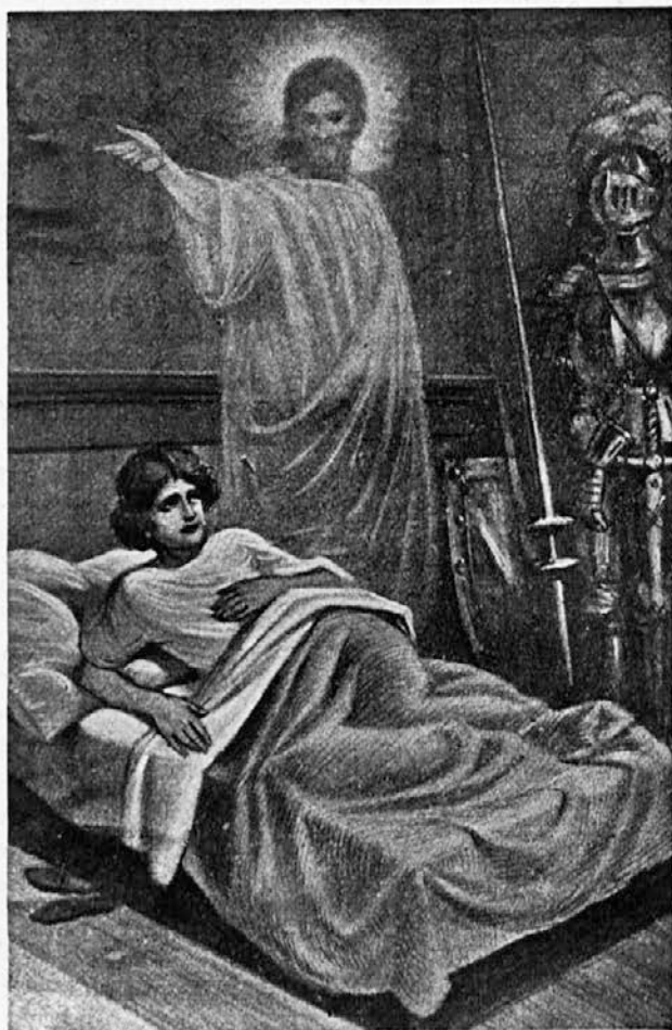
Vrni se v Asiz...

Toda vse se je zaokrenilo. Že v začetku svoje poti, v Spoletu, ga je popadla mrzlica in ni mogel naprej. Nepopisno ža-