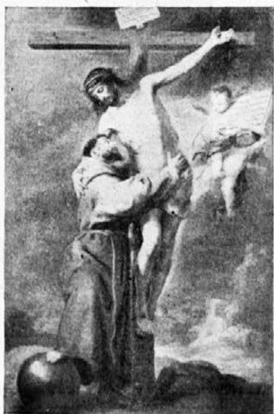
Moj Bog in moje vse. (Vzdihljaj sv. Frančiška.)

V družbi plavaš zdaj blesteči. Vse bogastvo ti je Bog. Z blagoslovcm nas osreči svojih prebodenih nog.