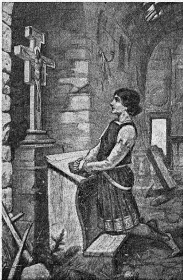
Frančišek je postal Kristusov vitez

kakor je znal res samo on. Brez uspeha? Ne! Otroci so Kristusa le še bolj ljubili. Radi so ubogali. Niso opuščali molitve. Tudi vse bolj čisti so bili. Tako so dejansko ljubili Jezusa. Frančišek jim je bil najskrbnejši varih in zelo vešč vodnik.