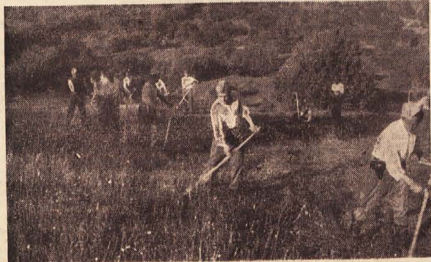
Enote Jugoslovanske armade pomagajo pri košnji v Kočevju

Naša Armada pa ni imela ogromne vloge samo pri socialistični preobrazbi vasi, ampak je nudila kmečkemu prebivalstvu tudi veliko praktično pomoč na najrazličnejših področjih. V zadnjih letih je obiskalo naše podeželje nad 1300 ekip vojaških zdravnikov, veterinarjev in raznih drugih specialistov. Ob teh obiskih