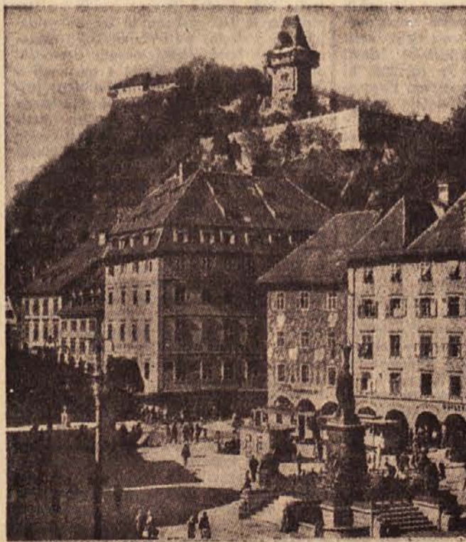
na osmino nekdanjega obsega. Od tega časa dalje se je za avstrijsko gospodarstvo začela trda borba za osvo-

Avstrijska industrija je večidel zrasla in se razvijala še za časa nekdanje monarhije. Obrobni predeli so ji dajali surovine (razne rude, kože in pod.) in pomorne surovine (premog), na ozemlju današnje republike pa so vse to predelovali v izdelke in polizdelke. Tako se je po prvem svetovnem požaru in razpadu nekdanjega cesarstva, komaj porojena avstrijska republika znašla pred dejstvom, da ima sicer močno industrijo z veliko zmogljivostjo, vendar neustrezajočo notranje tržišče, tržišče, ki se je skrčilo