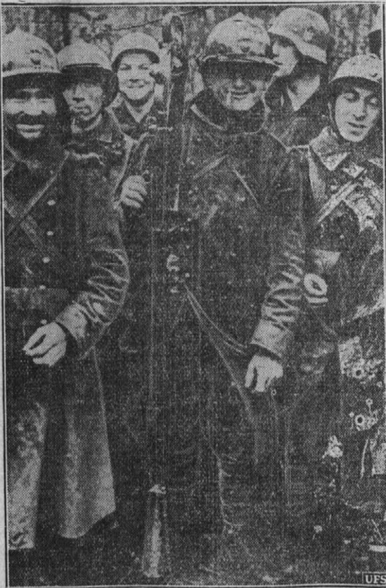
Francoski vojaki, ki so bili na zapadni fronti vjeti od Nemcev. Za njimi stojita dva nemška vojaka, ki ujetnike stražita.