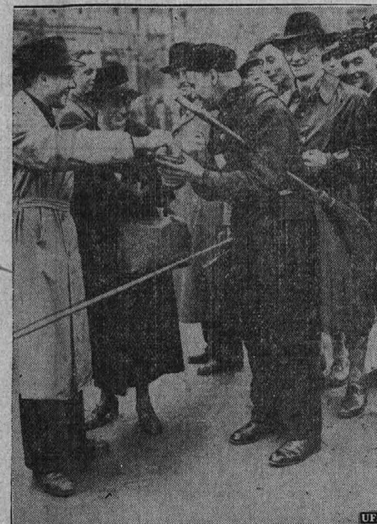
V Berlinu nabirajo za relief kar po ulicah. Vlada pozivlje narod, naj da letos več kot sicer druga leta.