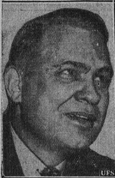
Kongresnik Dies, ki je načeljuje znanemu komiteju, ki preiskuje aktivnosti komunistov v Ameriki.