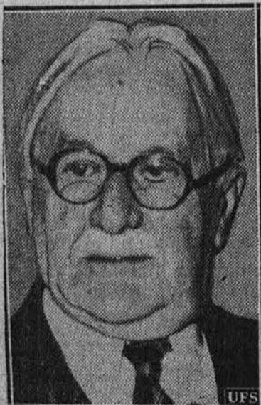
Gordon Selfridge, rojen Amerikaneec, ima v Londonu veliko department trgovino. Te dni je prišel domov na obisk.