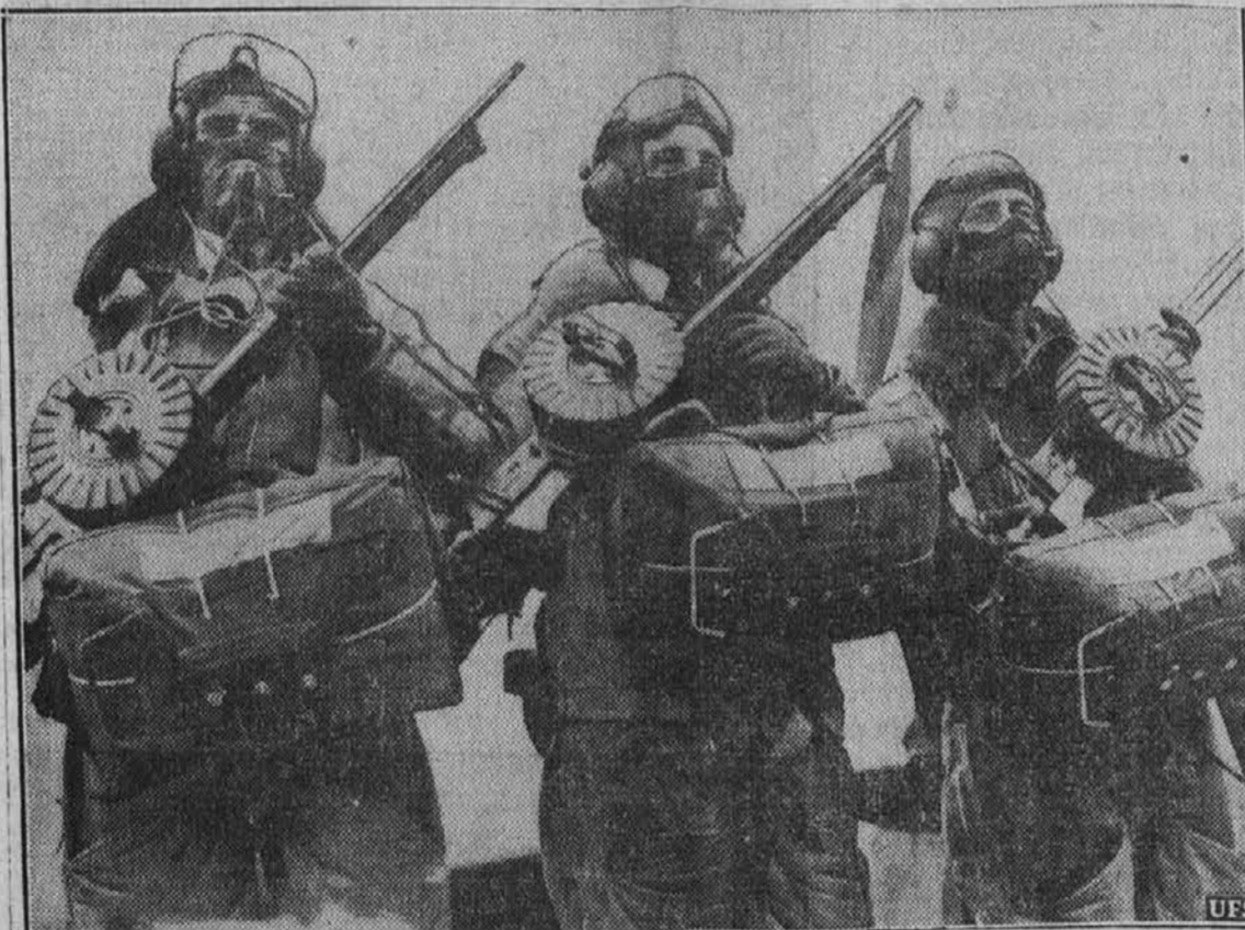
Tako so opremljeni angleški letalci, predno se dvignejo v zrak, da poletijo nad Nem- ce. Imajo strojnice, plinske maske in parašute. To je njih redna oprema.

MAR-KET COAL CO. 1261 Marquette Rd. Henderson 1588 FIN PREMOG! FIN PREMOG! Točna postrežba!