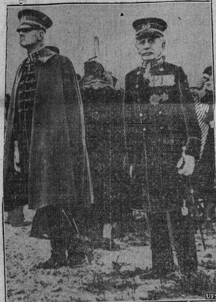
Na levo je baron Voorst Tot, vrhovni poveljnik nizozemske armade, na desno pa general Snyders, poveljnik nizozemske rezerve.