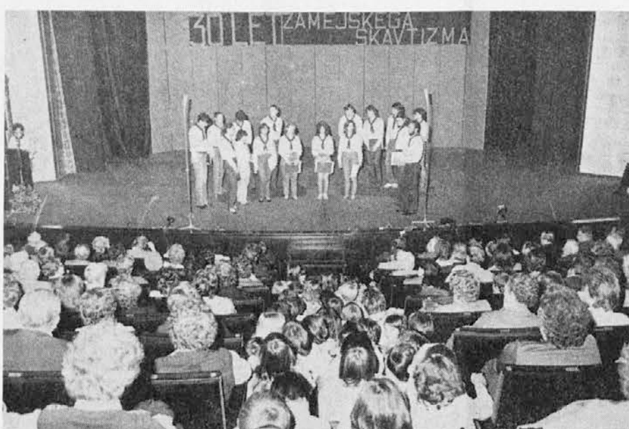
Del občinstva na prireditvi ob 30-letnici slovenskega zamejskega skavtizma v Kulturnem domu v Trstu

Pesem »Mnogajta ljeta« je sklenila ta prvi del prireditve, ki se je brez prekinitve nadaljevala s spletom diapozitivov, glasbe in komentarja, ki je nakazal osnovne točke skavtskega razvoja pri nas: usta-