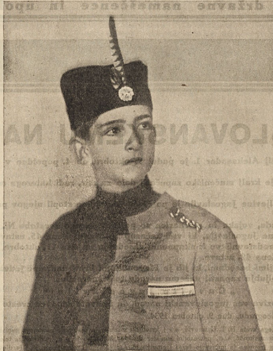
Nj. Veličanstvo kralj Peter II.

Viteški kralj Aleksander I., Zedinitelj je bil pa tudi globokoumen upravnik države in resnično moder zakonodajalec. Ko so strankarske strasti prikipele do vrhunca in grozile uničiti s toliko krvi priborjeno svo-