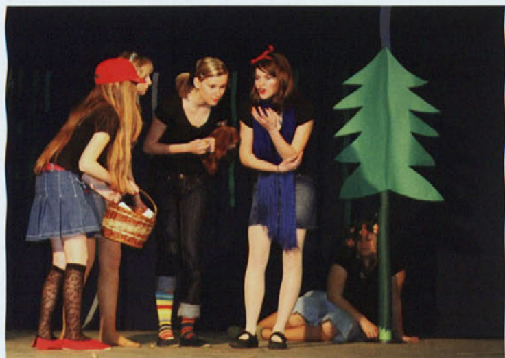
Tudi letos smo se učence dramskega krožka OŠ Juršinci udeležile Območne revije otroških gledaliških skupin. Prireditev se je odvi-

jala 13. 3. 2007 v Grajeni, predstavilo pa se je osem skupin: Grajenske marjetice, Mini teater Zveze kulturnih društev Ptuj, Dramska s plesno skupino OŠ Juršinci, Otroška gledališka skupina Skorba, Čebelice OŠ Markovca, Gledališki krožek OŠ Majšperk, Gledališki klub Cirkovce, Gledališki studio Gimnazije Ptuj.