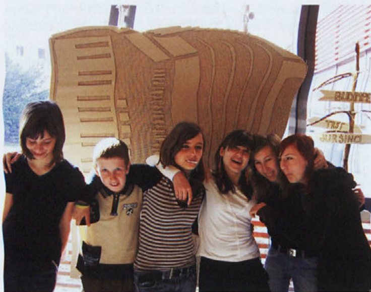
Projekt Turizmu pomaga lastna glava je celovit sistem organizira-

nega delovanja osnovnošolske mladine v turizmu. Turistični podmladek OŠ Juršinci se je tudi letos prijavil na 21. festival Turizmu pomaga lastna glava pod naslovom S turizmom gradimo mostove. Območni festival je potekal na OŠ Olge Meglič, z raziskovalno nalogo, odrsko predstavitevijo in razstavo pa je nastopilo osem šol: OŠ SV. JURIJ - JUROVSKI DOL, OŠ LJUDSKI VRT - PTUJ, OŠ OLGE MEGLIČ - PTUJ, JVIZ DESTRIK-TRNOVSKA VAS - DESTRIK, OŠ JURŠINCI, OŠ TOMAŽ - SVETI TOMAŽ, OŠ VIDEM - VIDEM PRI PTUJU, OŠ ANICE ČERNEJEVE - MAKOLE.