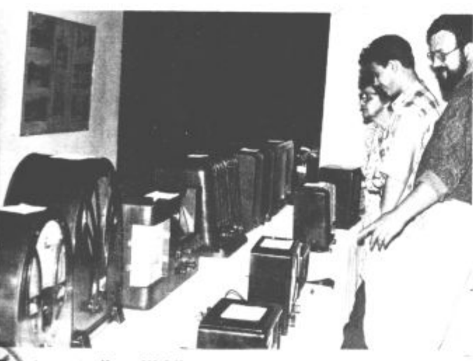
Razstava starih radijskih aparatov je pritegnila veliko obiskovalcev