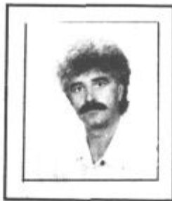
Piše: VINKO VASLE

Tudi letos bodo velenjski ribiči tekmovali v lovu na najtežjo ribo za naslov car-carica. Tekmovanje bo potekalo v okviru že 10. tradicionalnega piknika, ki bo v soboto, 24. avgusta ob 14. uri.