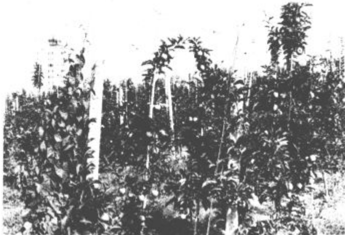
Zorenje jabolčnikov na velenjskem griču

Kar se tiče jablanove plešni zdaj ni več čas za škropljenje, prav tako ne za zatiranje rdeče sadne pršice, saj po tem času ni dovoljen več nobeden kemični pripravek. Seveda lahko dre-