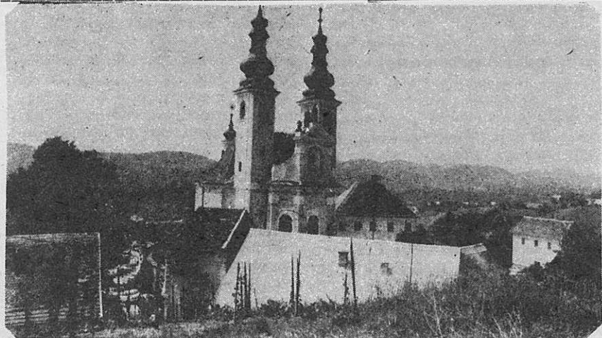
Med vinorodnimi griči je skrita Marijina cerkev na Sladki gori

TRZIČ — Tržiška čevljarska industrija „Peko“ je za leto 1980 pripravila zahteven proizvodni načrt. Polovico proizvodnje bodo skušali prodati na tuje, od tega seveda največ na Zahod (kar 88 odstotkov). Pravijo, da ne bodo imeli težav, ker imajo že sedaj dovolj naročil za prvo polovico leta.