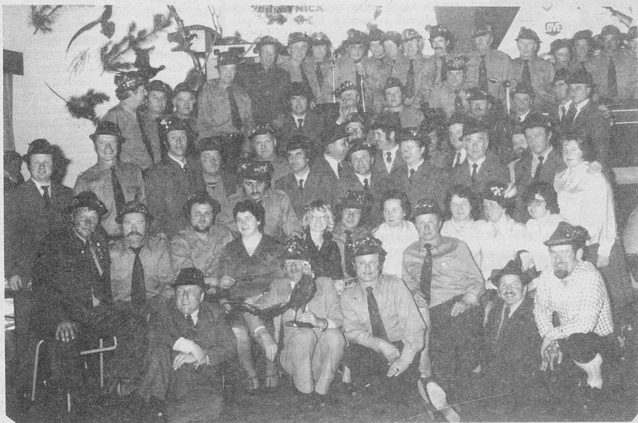
Lovska bračočina Sydneya, Planice-Springvale in Melbournea.