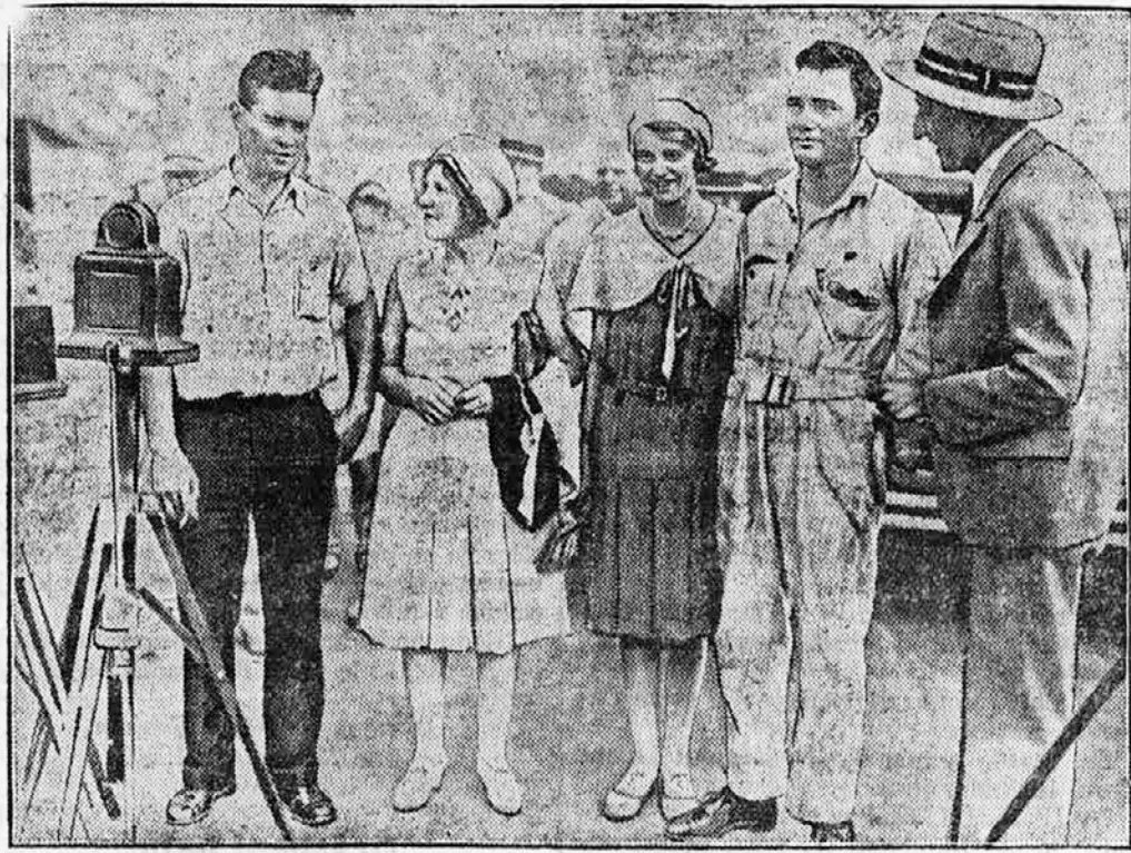
647 ur v zraku.

V Nemčiji, zlasti v Porenju, kjer rastejo slovita porenška vina, se praznuje te dni vesela trgatve zgodnjega grozdja. Naša slika nam kaže precej vesele obirače, ki se vesele dobre letine.