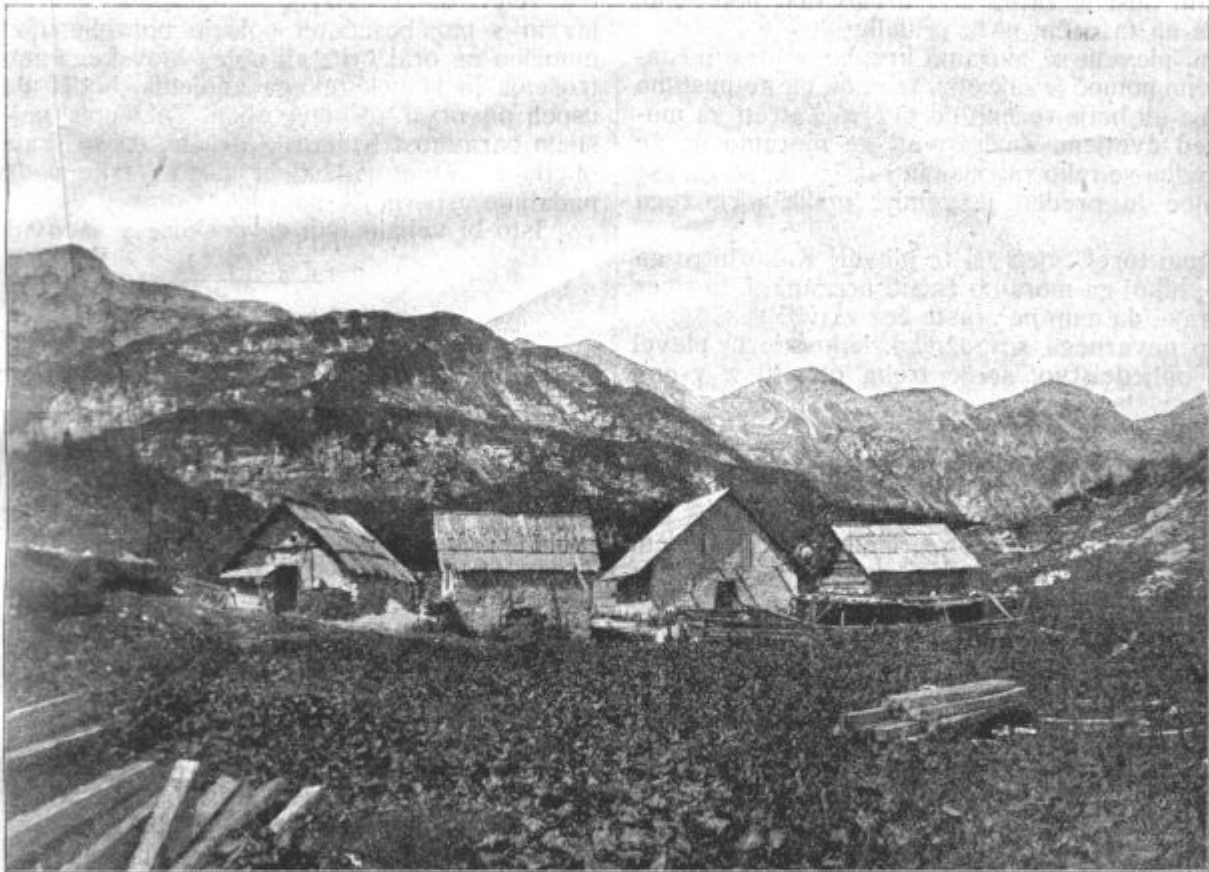
Pod. 37. Planina „Vogu“ v Bohinju. (Hlevi in koča zgrajeni po Agrarnih operacijah.)

kor druge bohinjske planine je bila tudi ta planina grdo zanemarjena in je deloma še. Veliko sveta je bilo posutega z gruščem, velik del planine je kamnit, najbolj rodovitne dolinke so pa polne ščavja in drugega plevela in grmovja. Tudi koče so bile zanemar-