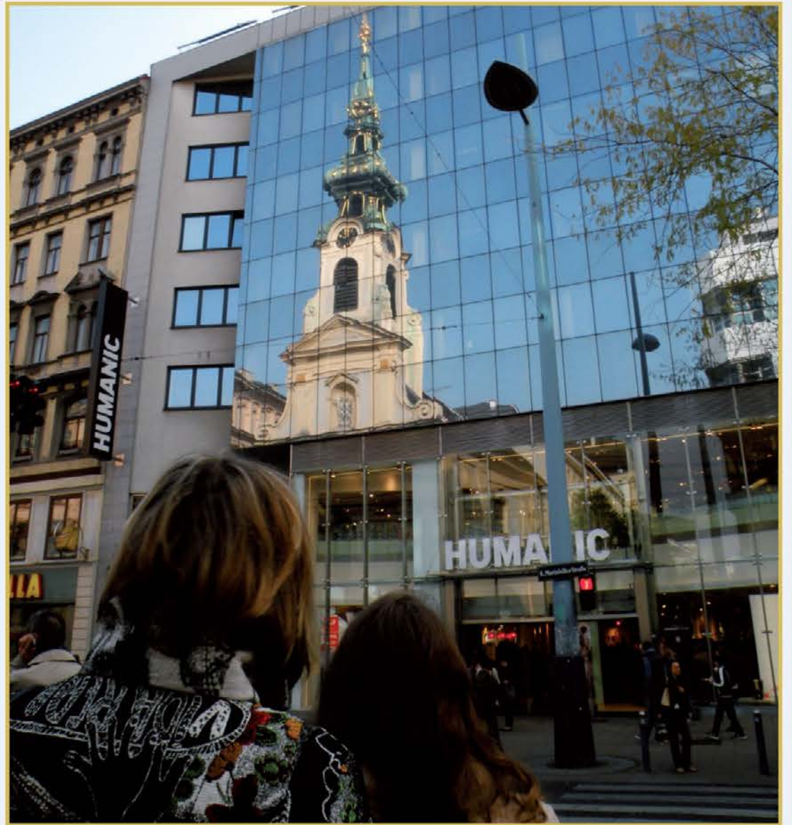
Prišel je čas, da na novo ovrednotimo in odkrijemo pomen besede. Prišel je čas, da razglasimo leto tišine in utihnemo.