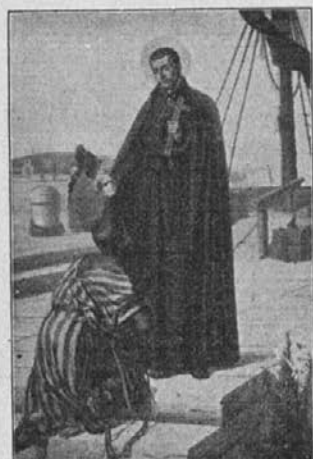
Sv. Peter Klaver, apostol zamorcev, prosi za nje in za naše podjetje!