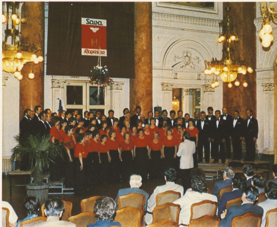
Skupen nastop moškega in ženskega pevskega zbora Zdravilišča Rogaška Slatina