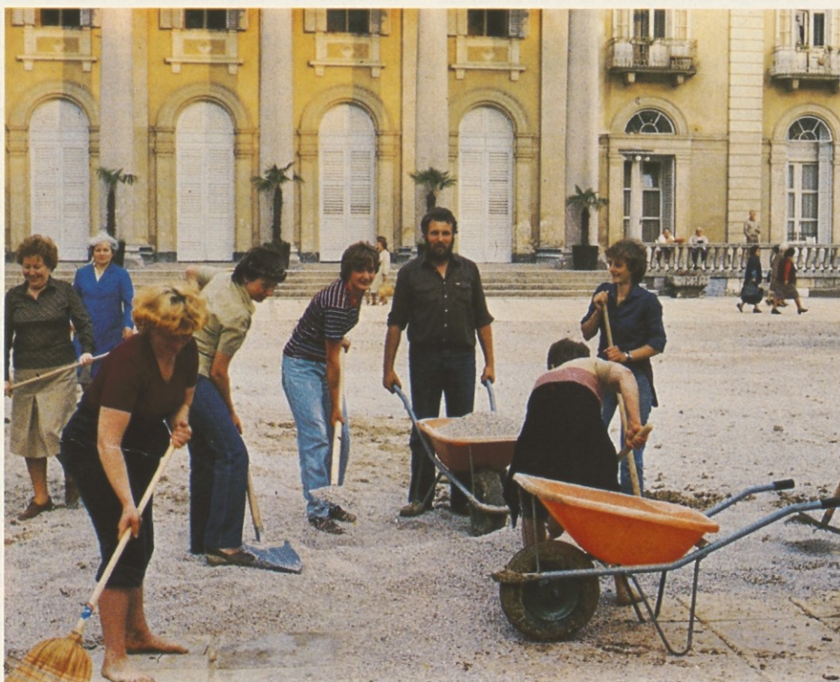
Udarniško urejanje zdraviliškega parka