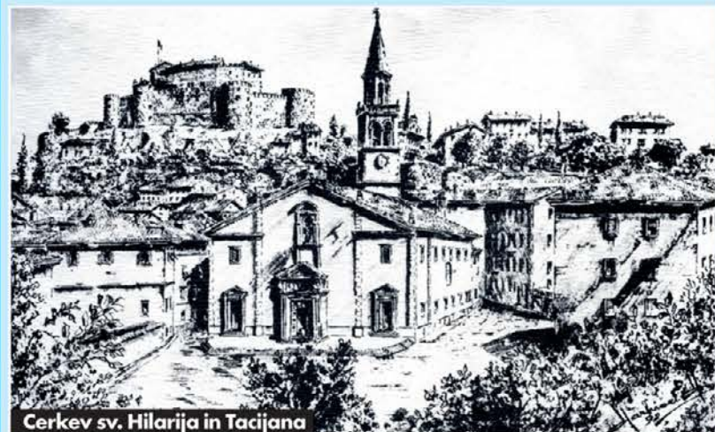
Cerkev sv. Hilarija in Tacijana