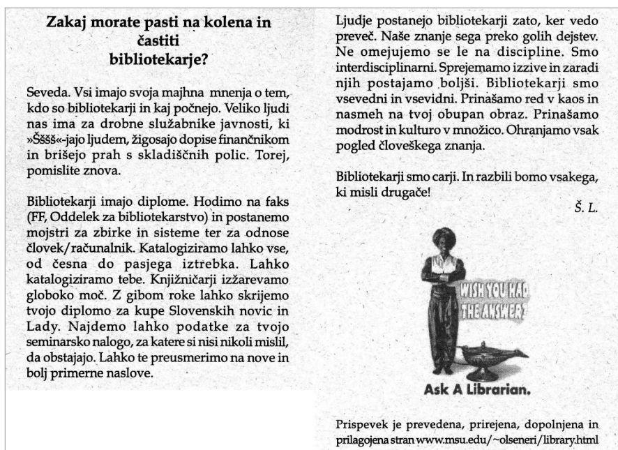
Slika 2: Prevod članka, objavljenega na blogu Librarian Avengers (Lah, 2000).

Leta 2000 je v reviji Šubidu (Lah, 2000) izšel prevod članka, objavljenega na blogu Librarian Avengers (Firment, 1997), ki na humoren način govori o naši samopodobi.