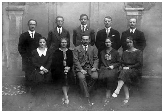
Slika 1: Knjižničarji Šentjaponske knjižnice na Starem trgu

Knjižničarji sami sebi pripisujemo številne lastnosti in kvalitete. Helen Keller je že leta 1909 na srečanju Pennsylvania Library Club (Keller, 1909) opisala kvalitete, ki jih mora posedovati knjižničar: urejen videz, izbrano vedenje, izogibanje alkoholu, tobaku in drogam, izogibanje igranju na srečo. Za delo v knjižnici je moral biti knjižničar skoraj vsemogočen, vseveden in vseprisoten, delal je s skoraj nadčloveško energijo in navdušenjem in seveda daleč preko obveznega delovnega časa.