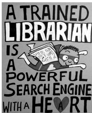
Slika 6: Promocijski plakat

Knjižničarji svojega dela ne moremo meriti s tem, koliko zaslužimo, ampak kako kakovostno je opravljeno.