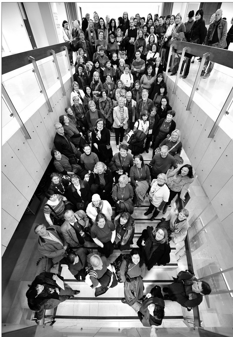
Slika 5: Udeleženci strokovnega posveta ZBDS, Maribor 2011

niso tisto, kar od njih pričakujejo. Vendar je moč vsakega združenja odvisna od aktivnosti in angažiranosti vsakega posameznika ter njegove pripravljenosti plačevati članarino 7 .