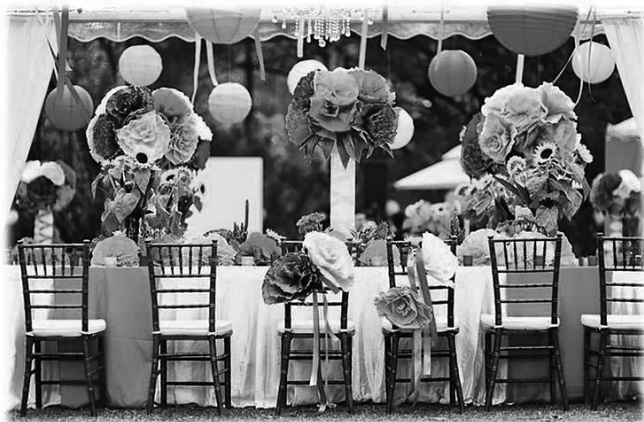
Slika 7: Zabava za bogato obloženo mizo informacijske družbe