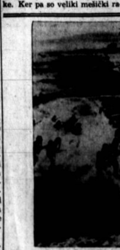
Ameriški vojaki na manovirih v nekom kraju severne Iraka.

Iz tega se je počasi razvilo najvažnejše lovsko orožje Eskima, harpuna z vrvico in lovilni mešičkom. Da bi vlovili velike morske živali, so pritrjili na puščice vedno večje mešičke. Ker pa so veliki mešički ra-