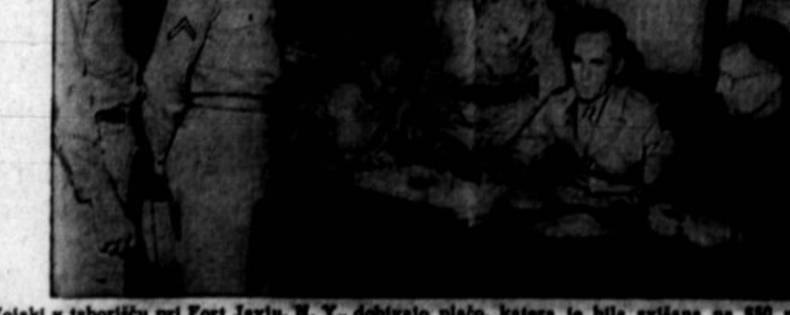
Vojaki v taborišču pri Fort Jayu. N. Y. dobivajo plačo, katere je bila svišana na $80 na mesec.

Stirje delavci ubiti pri eksploziji Waynesville, N. C., 16. jul. — Stirje delavci so bili ubiti in ossem ranjenih pri eksploziji, ki se je pripetila v čistilnici olja Standard Oil Co. Čistilnica in poslopja v bližini so bila poškodovana.