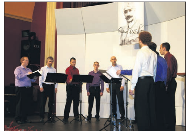
Ob dnevu generala Maistra v Ljutomeru je zapel domači oktet Arion.