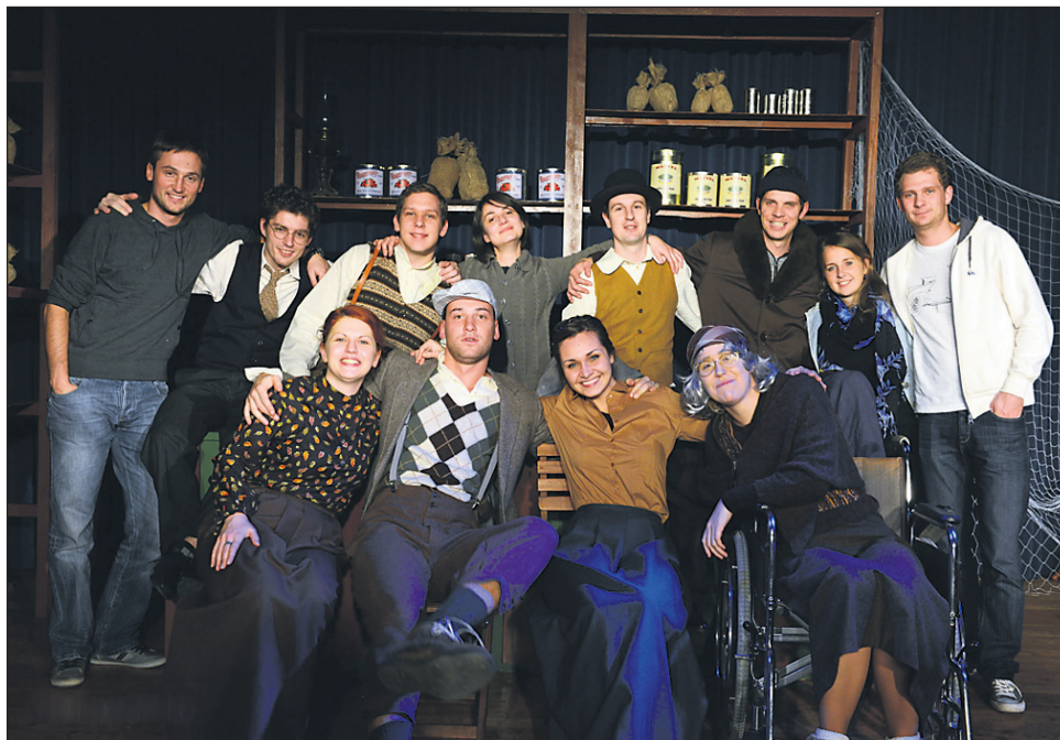
Z najnovejšo premiero Kripl Šus teatra KD Draženci

Tudi najnovejša premiera Šus teatra je navdušila občinstvo. Tisti, ki so v soboto zamudili premiero, si lahko predstavijo ogledajo na decembrskih ponovitvah.