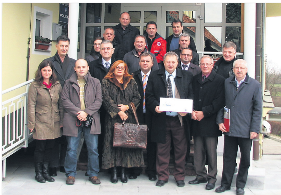
Udeleženci zadnjega delovnega srečanja v okviru projekta Pavolor so govorili o možnostih skupnega sodelovanja različnih društev na področju civilne zaščite, sicer pa so se vsi vključeni v projekt strinjali, da se bodo v prihodnje povezovali še na področju razvoja turizma, podjetništva in delovanja ostalih društev (kulturnih, športnih ipd.).

Zbrani so ugotavljali, da imajo omenjena društva v eni in drugi državi približno enake težave, da je treba narediti veliko za spodbujanje mladih, ki bi se včlanjevali v tovrstna društva, ter da bi s skupnim nastopom oz. kandidaturo na razpise lahko lažje prišli do sofinanciranja predvsem izobraževanj in usposabljanj ter drobne opreme, izvajali pa bi lahko tudi skupne vaje. Pri velikih naravnih katastrofah, kot je bilo novembrsko poplavljanje Drave, pa brez pomoči države