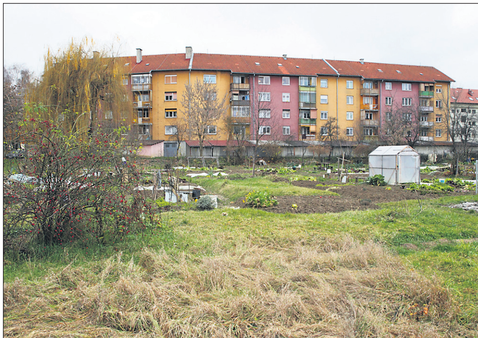
Ob Osojnikovi, kjer so še do nedavnega načrtovali gradnjo velikega vrtca, bo ponovno rasla zelenjava.