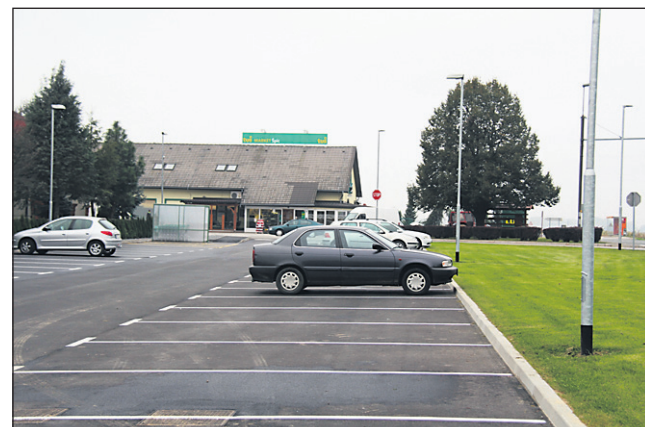
Z ureditvijo parkirišča je podjetje Han pridobilo 42 novih parkirnih prostorov.