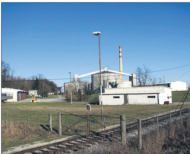
Ker v TSO ni bil porušen silos za skladiščenje sladkorja, bo morala Slovenija vrniti 8,7 milijona evrov od skupno prejetih 34,8 milijona za prestrukturiranje sladkorne industrije v državi.

„V odobrenem načrtu prestrukturiranja TSO je bila predvidena možnost ohranitve dejavnosti pakiranja in odpreme sladkorja, za kar so potrebni silosi in naprave za pakiranje. Na območju tovarne se nahajata dva silosa kapacitete 10.000 ton in 35.000 ton. Manjši silos je v polovični lasti Republike Slovenije in služi za skladiščenje državnih blagovnih rezerv, zato njegova odstranitev ni bila predvidena. Pogojno je bila predvidena odstranitev večjega silosa za sladkor, z