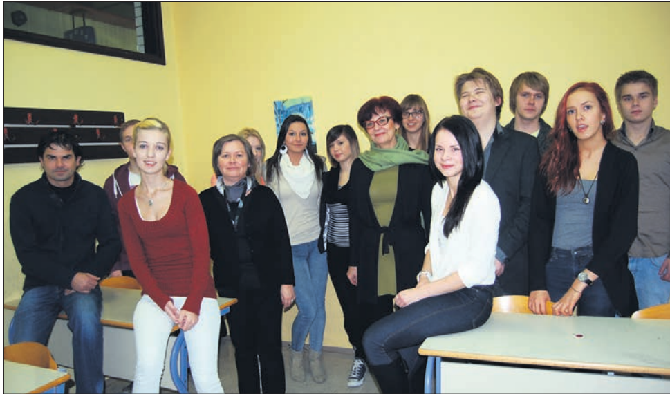
Dijaki in mentorji Ekonomske šole Ptuj in finske ekonomske šole iz Lahtija, ki so sodelovali pri projektu.