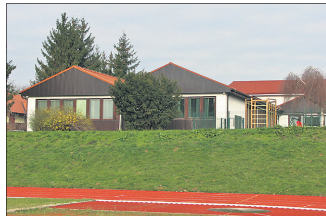
Občina Središče ob Dravi bo sofinancirala tudi obnovo OŠ Stanka Vraza.