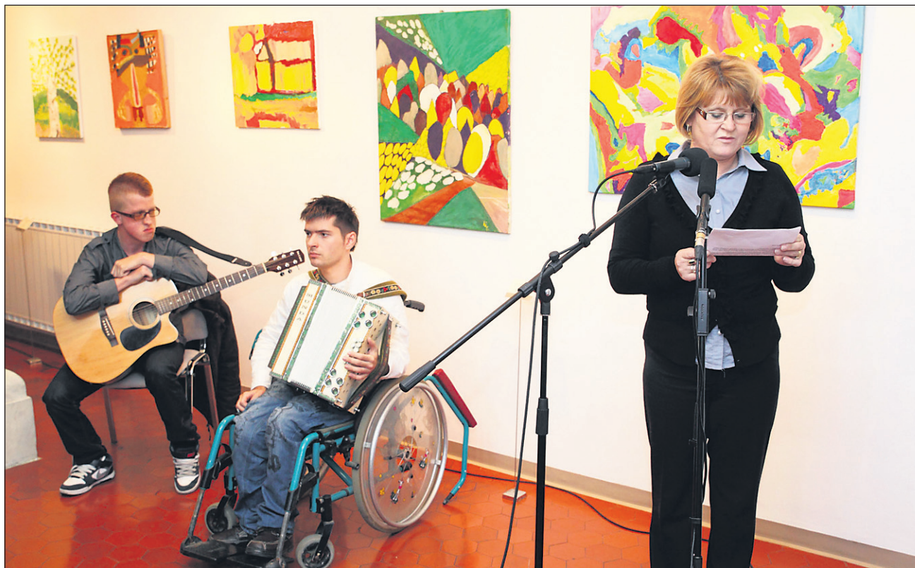
Z odprtja razstave likovnih del invalidov v okviru projekta Občina po meri invalidov

»Nedvomno je v človekovi naravi skrita želja po udeležanju svojih izraznih možnosti. To nas je kot organizatorje tega lepega dogodka navedlo, da smo želeli priklicati plemenite lastnosti avtorjev razstavljenih del in širši javnosti pokazati pestrost in razkošnost talenta, ki vse prevečkrat ostaja skrit ali redkokdaj izpovedan. Raz-