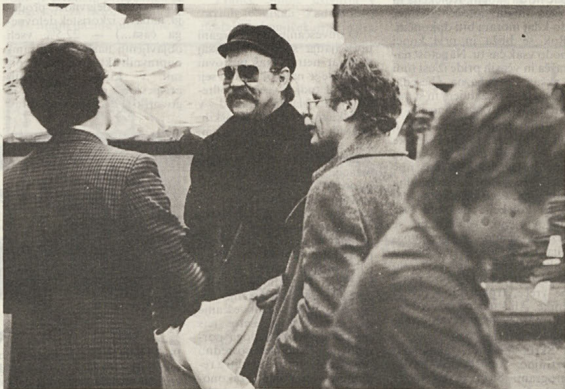
Na tednu slovenskega filma v Novem mestu je bil gost režiser zelo uspelega mladinskega dela Nobeno sonce, Jani Kavčič. Obiskal je tudi tozd Ločna.

Obveznosti iz dohodka so glede na plan višje za 43%, glede na leto 83 pa za 85%. Glavni delež takega povečanja predstavljajo obresti, ki so se povečale trikratno in znašajo v strukturi celotnega prihodka že 4,2% (leta 83 2,0%). Primerno indeksom porabljenih sredstev in obveznosti iz dohodka je indeks rasti čistega dohodka, ki je glede na plan 107,8 in glede na leto 83 118,9.