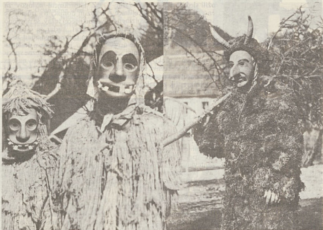
Lika iz laufferije: Ta-tirjasti je zadolžen za red. Obleko ima iz »tirja« to so ostanki od tkanja platna. Poleg njega pa je Pust, ki ima obleko iz mahu. Simbolizira zimo in vse slabo, kar se je zgodilo preteklem letu. Zato ga na pustni terek obsodijo na smrt z batom.