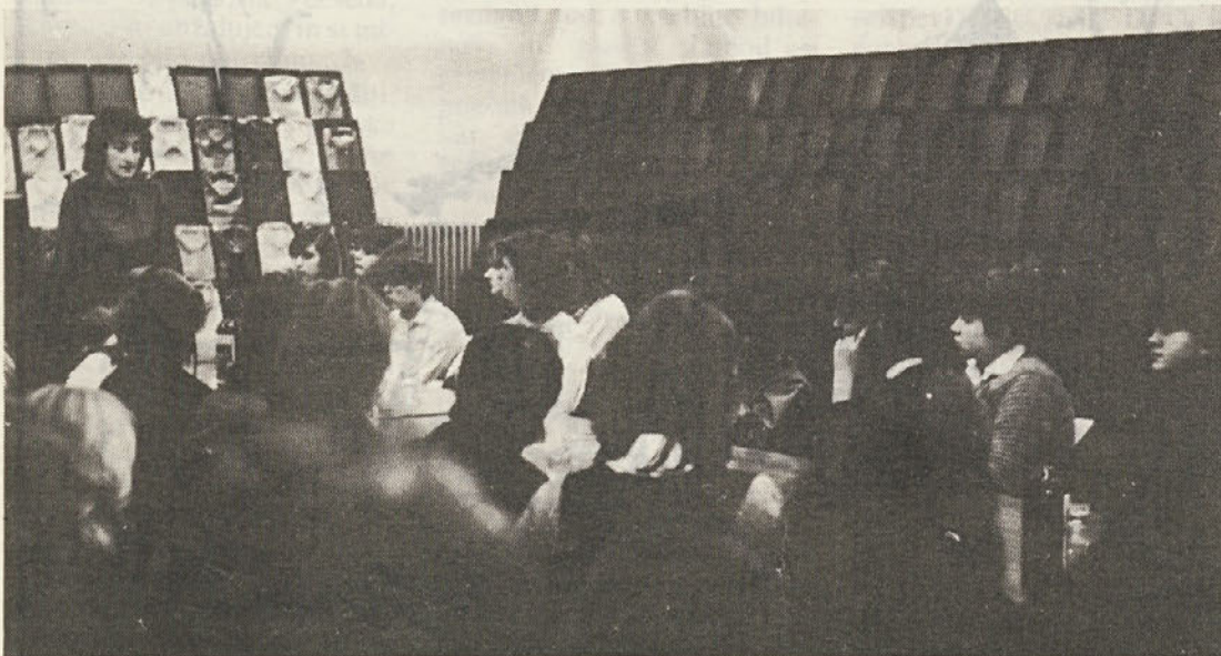
Zbrali so se študenti iz DSSS in tozdov Ločna, Commerce, Libna in Temenica, ki se šolajo na stopnjah III do VII. Na sestanku jih je bilo 60, še enkrat toliko pa jih je v ostalih tozdih.