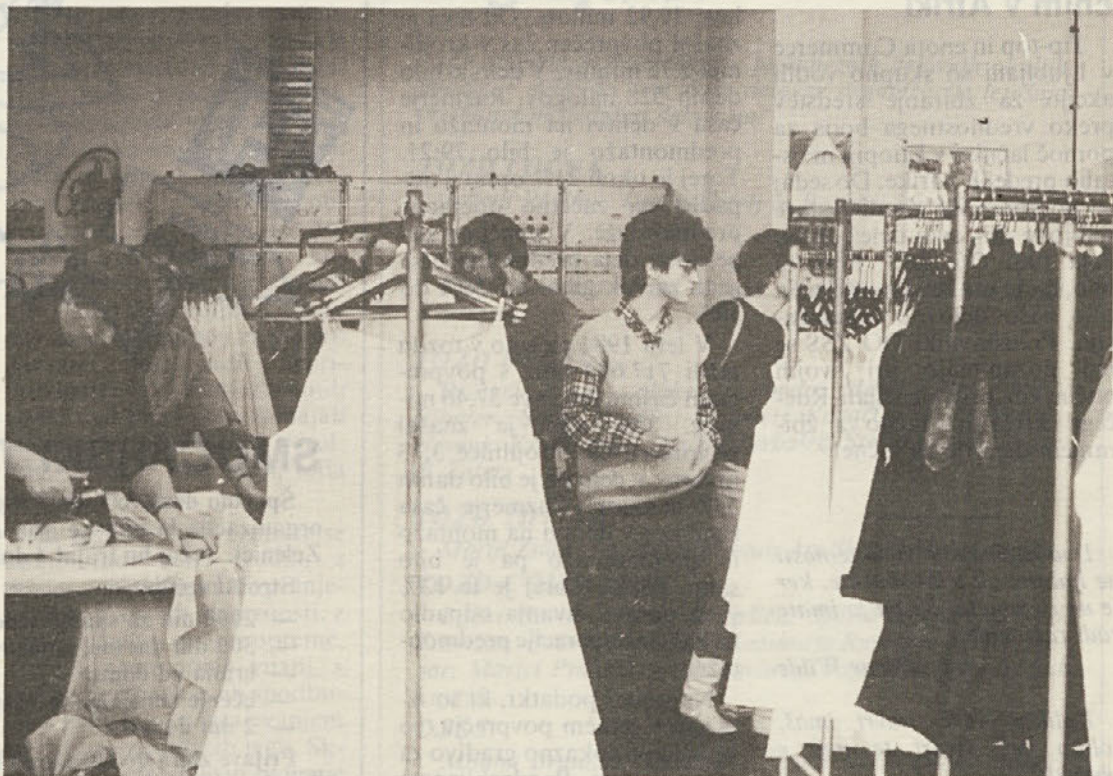
Organizatorji kulture v idrijski občini so si ogledali razstavo nagrajenih del na Labodovih temporih in proizvodnjo v Zali, nato pa je stekel pogovor o njihovem delu.

organizirane akcije so bile prepovedane. Prvotne maske so se v glavnem porazgubile, ostale so le 3, ki jih ima v varstvu Etnološki muzej v Ljubljani. Po ustnem izročilu in slikah so domačini izdelali avtentične maske, ki so vse po vrsti iz lesa (precej jih je iz lipovega lesa) in ponovno obudili svoje laufferje.