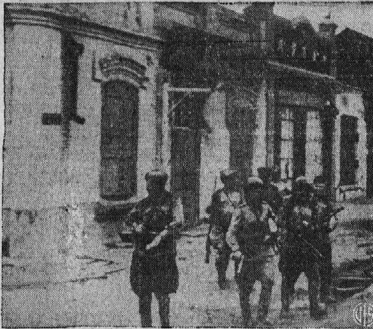
Vojaki redeče armade morajo biti zelo previdni na stražni službi po ulicah mesta Hailer v Mandžuriji, katerega so vzeli Japoncem. Premier Stalin je naznanil popolno zmago nad Japonci, ko je rdeča armada zavzela vso Mandžurijo.