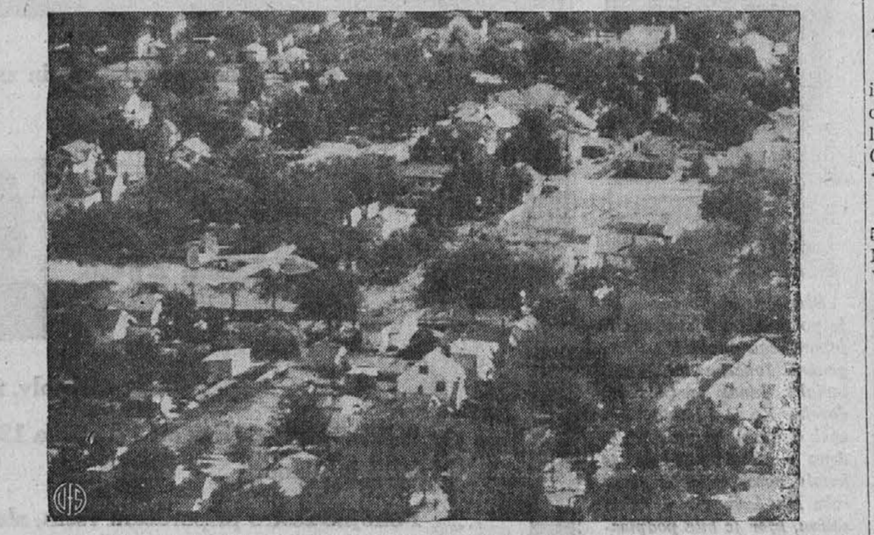
Komaj nad vrhovi dreves leti B-25 bombnik, ki je opremljen s posebnim tankom, iz katerega prši DDT razstopino, ki je posebno učinkujoča pri uničevanju raznega mrčesa. S tem poskušajo zatreti muhe, o katerih sčijo, da prenašajo bacil paratife. Slika je bila posneta nad mestom Rockford, Ill., kjer so nad polovico mesta razpršili 1,650 galonov te razstopine, da bodo lahko primerjali učinek nad drugo ne poškerplo polovico mesta.

Pomagajte Ameriki, kupujte Victory bonde in znamke.