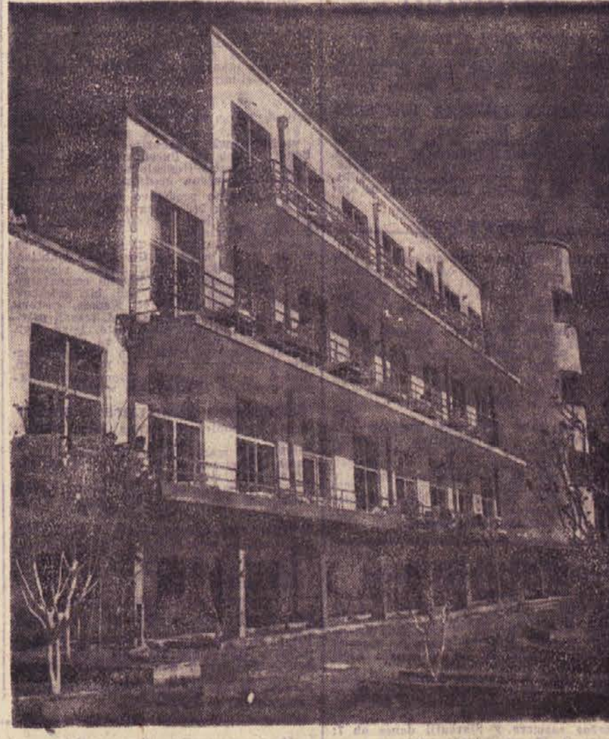
Skrb ljudske oblasti za delovnega človeka. Zdravilišče za kostno tuberkulozo v Biogradu

Po prospektu Jadranske pomorske agencije je določeno, da bo do konca tega meseca odplulo iz reske Luke na potovanje 11 domačih in tujih oceanskih linijskih ladij. V soboto je odplula motorna ladja »Titograd« v Beyruth in Aleksandrijo. Parnik »Zužemberk« odpluje v Turčijo. V ponedeljek (20. t. m.) je odplul parnik »Podgora« ki vozi na progi Reska—Severna Evropa.