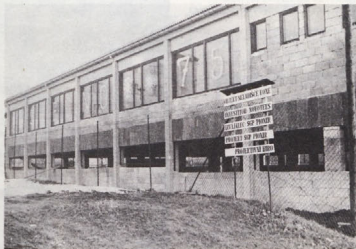
Na 23. zasedanju delavskega sveta, bilo je 23. aprila 1974, je bil sprejet sklep, da se zgradi centralno skladišče gotovih izdelkov za TOZD Konfekcija in obenem tudi centralno krojilnico. Na sliki: skladišče je že skoraj gotovo.