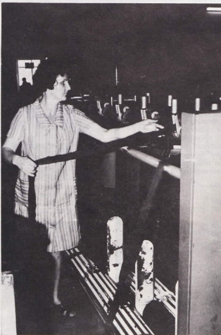
Vsi se moramo zavzemati, da bo naše delo res varno. Varno delo je pravica in dolžnost vsakega delavca.

Prva navedena postopka prizadeta organizacija združenega dela in odgovorno osebo, druga dva pa samo odgovorno osebo. Novost pri kazenskih določbah novega zakona je tudi, da je lahko mandatno kaznovan tudi neposredni kršilec (delavec), ne pa samo odgovorni vodja (kot je bilo določeno v dosedanjem zakonu), ter da se kršitev varnostnih predpisov obravnava kot gospodarski prestopok, za kar so predvidene visoke denarne kazni.