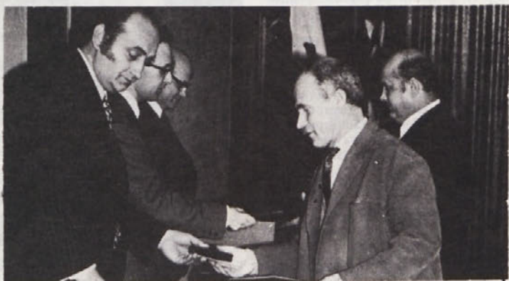
Decembra smo na Otočcu podelili priznanja našim zvestim 10 in 20 letnikom, ter upokojujencem za njihovo zvestobo našemu podjetju