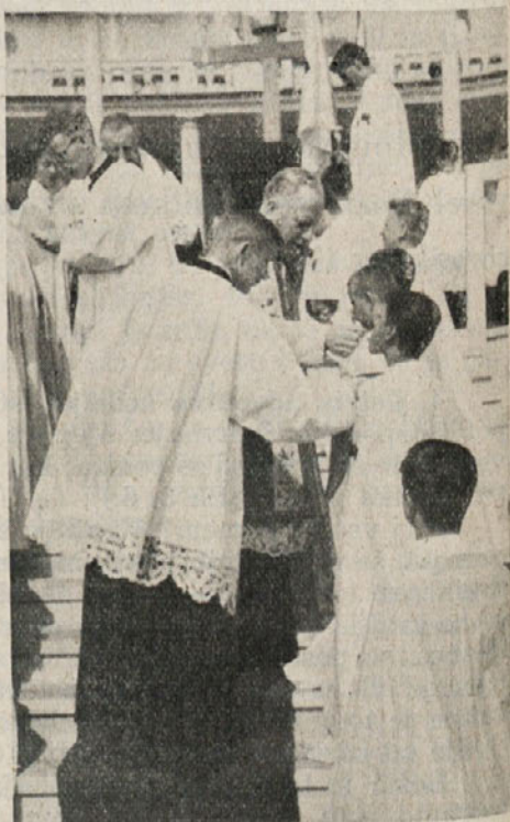
Slovenska škofa obhajata Frančiškove križarje

Sprevod na stadion se je pričel kmalu po 7. uri. Na čelu sprevoda so korakali Veliki Frančiškovi križarji v svojih impozantnih viteških plaščih. Nato se je vrstila skupina za skupino, ena lepša od druge. Nekateri so nosili banderca, drugi palme, drugi zopet znamenja naše vere: križ, jagnje, podobo hostije. Na poti so otroci peli kongresne pesmi. Ljudje so postajali po ulicah in vprašujoče gledali: Odkod toliko tega pestrega drobiža. Vsem smo na obrazih brali neko tiho notranje zadovoljstvo ob misli, kako Kristus