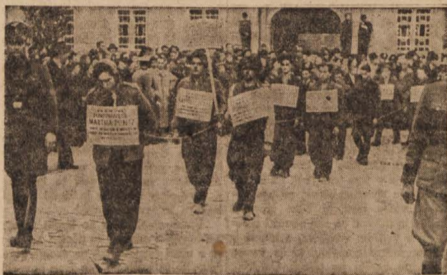
Tako so vodili fašistični psi borece za svobodo po Celju in vseh večjih štajerskih krajih, nato pa jih pobili. (Slika iz marca 1942.)

Prvič po začetku svetovne vojne snažijo in obnavljajo zunanost in notranost starodavne kremelske zgradbe. Trume rokodelcev so, na delu ob poslopju, v orožarni pa so zopet razstavljene z dragulji posute krone nekdanjih carjev, kronski ornati, žezlo in drugi dragoceni predmeti, ki so bili prinešeni zopet v Moskvo. (TASS)