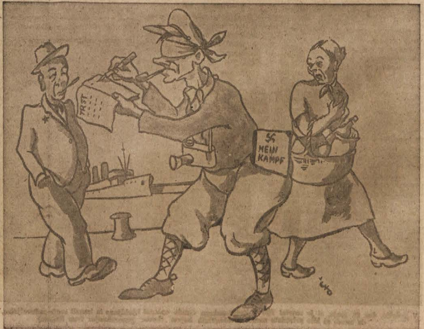
»Objektivni« tuji novinar zbira v Trstu podatke o dejanskem stanju