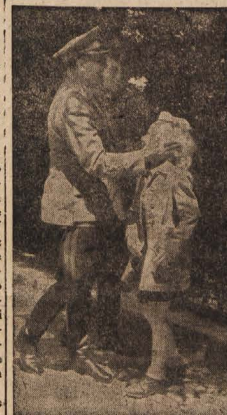
Maršal Tito se je prisrčno zahvalil pionirki za enako prisrčne vzklike. (V nedeljo, dne 27. maja, na Ljubljanskem gradu.)

Delajmo z ljubeznijo, požrtvovalno in z vsemi silami za novo, Titovo Jugoslavijo!