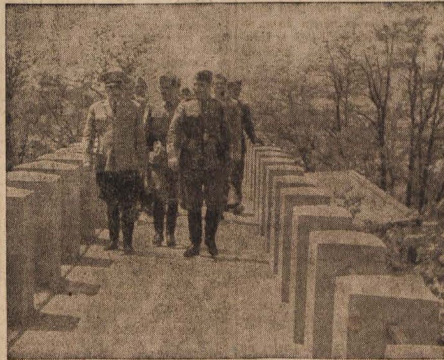
Maršal Tito na nedeljskem sprehodu po ljubljanskem gradu. (Desno: generalmajor Ivan Maček in generalmajor Aleksander Rankovič.)

V razgovoru z generalmajorjem Ivanom Mačkom je maršal Tito po-