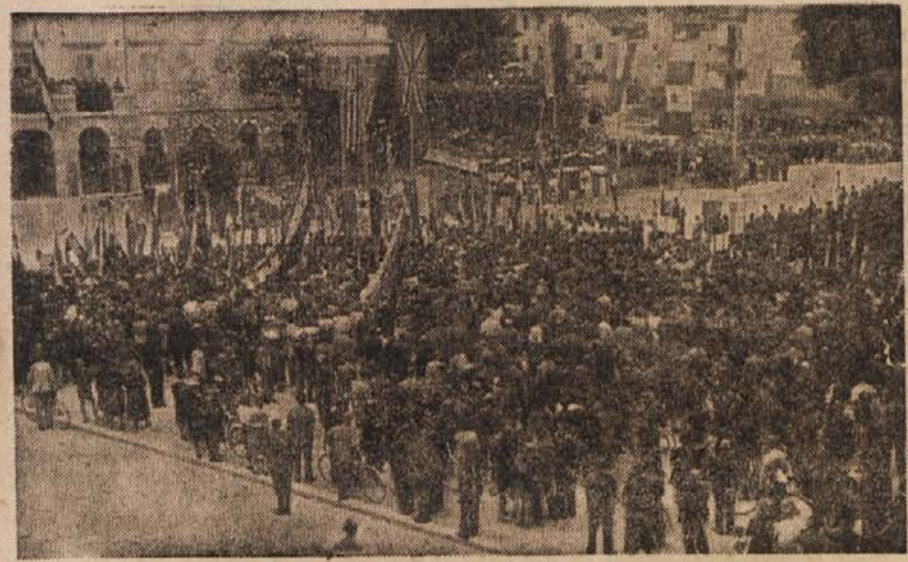
Gorica je veličastno proslavila Titov rojstni dan.