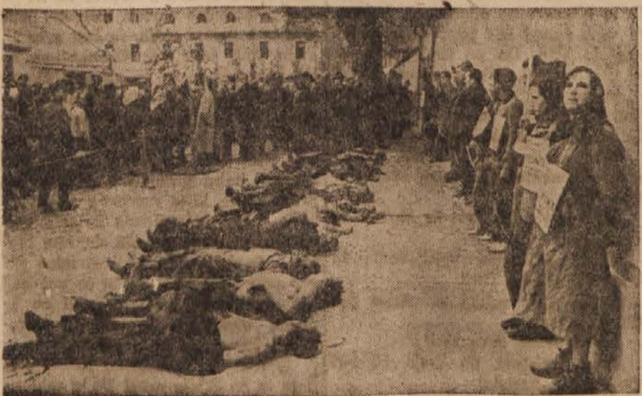
Marca 1942 so nemški fašisti v Celju pobili dvanajst ujetih partizanov, jih javno razstavili, poleg njih pa razstavili nadaljnjih dvanajst lačnih, premaženih in zverinsko mučenih partizanov. Tem so obesili vsakemu okoli vratu tablo z napisom: »Ich bin Bandit...« ta in ta. Po štirinajsturnem mučenju in javnem razkazovanju so pobili tudi teh dvanajst mučencikov, ki so prenašali hrabro in ponosno vse te gohe in zaničevanja.