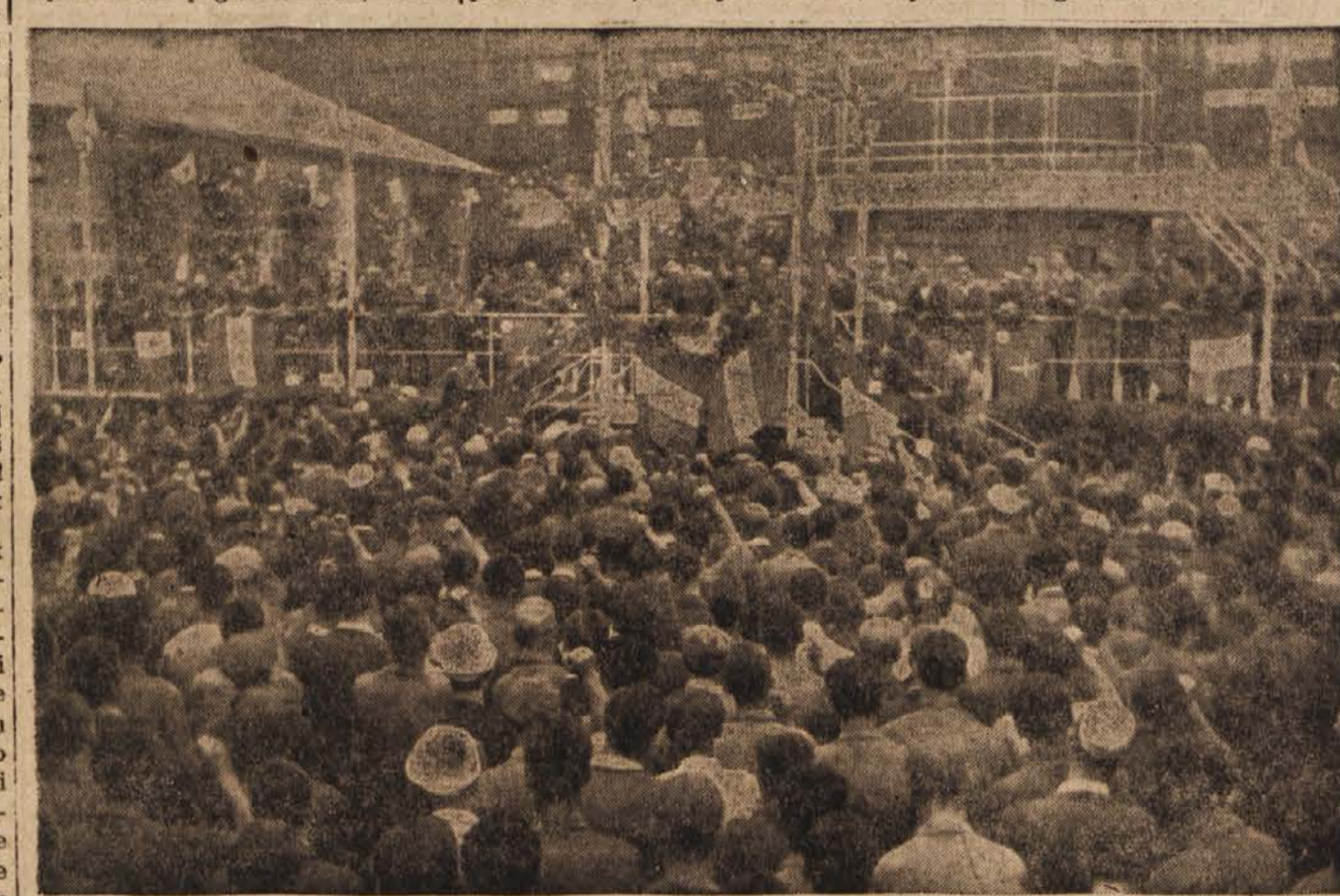
V tržaški ladjedelnici San Marco so delavci na močnem zborovanju navdušeno izražali svojo ljubezen in predanost maršalu Titu

smo se borili za njeno svobodo. To je v našem imenu in v imenu vseh jugoslovanskih narodov razločno povedal tudi naš veliki maršal Tito, ko je v soboto v Ljubljani dejal: »Niso še osvobojeni naši bratje na Koroškem. Oni čakajo na svojo osvoboditev. V vašem imenu in v imenu vse Jugoslavije — izjavljam, da nismo pozabili na naše brate na Koroškem, ki danes žal še dalje drhtijo in trpijo pod terorjem gestapovcev, preoblečenih v druge uniforme!«