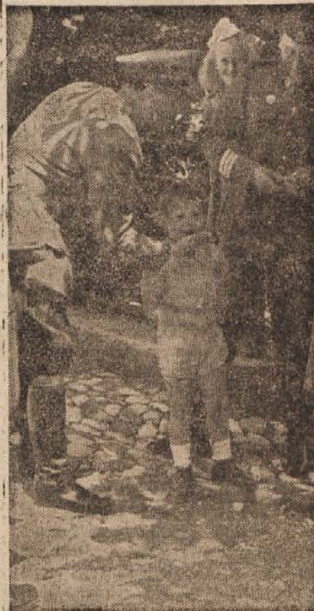
Maršal Tito ljubi mladino

Po končanih govorih je bila še prečitana brzozavka s čestitkami tovarišu maršalu Titu. Vojaški in ljudski pevski zbor sta zapela nekaj partizanskih pesmi, za konec pa je vsa množica zapela himno »Hej Slovani«.