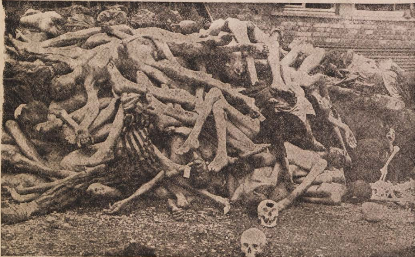
Obtožujemo. Nemski fašisti so pred svojim pobegom iz Dachau-a zapustili zločinski sled: pred krematorijem je bilo na kupe trupel internirancev, ki so jih pobili. — Do kraja se bomo borili proti vsem ostankom fašizma, da se tako grozovita zločina nikdar več ne bi mogla ponoviti. V duhu moskovske in teheranske pogodbe zahtevamo od naših zaveznikov izročitev vseh vojnih zločincev!