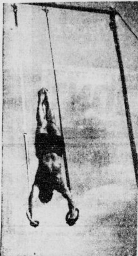
Naši fantje se pridno pripravljajo na velike mednarodne tekme katoliških telovadcev, ki bodo konec junija na ljubljanskem stadionu