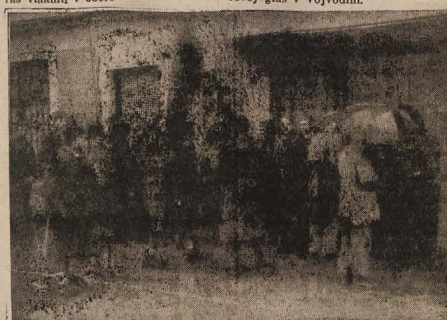
Pred voliščem pri Slamiču so se zbrali borci, da s svojim glasovanjem še enkrat potrdijo vse liste, za kar so se borili štiri leta in preživeli svojo kri.

Tovariš iz volivne komisije ji pojasnjuje: »To je skrinjica Ljudske fronte, to pa je skrinjica brez liste. Roko moraš vtakniti v obe!«