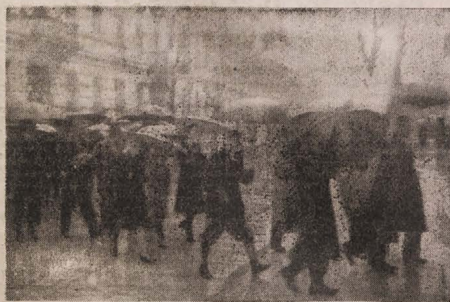
V snegu in dežju so Ljubljanci že zgodaj zjutraj hiteli na volišča, da oddajo svoje glasove za Tita, za demokratično federativno republiko Jugoslavijo.