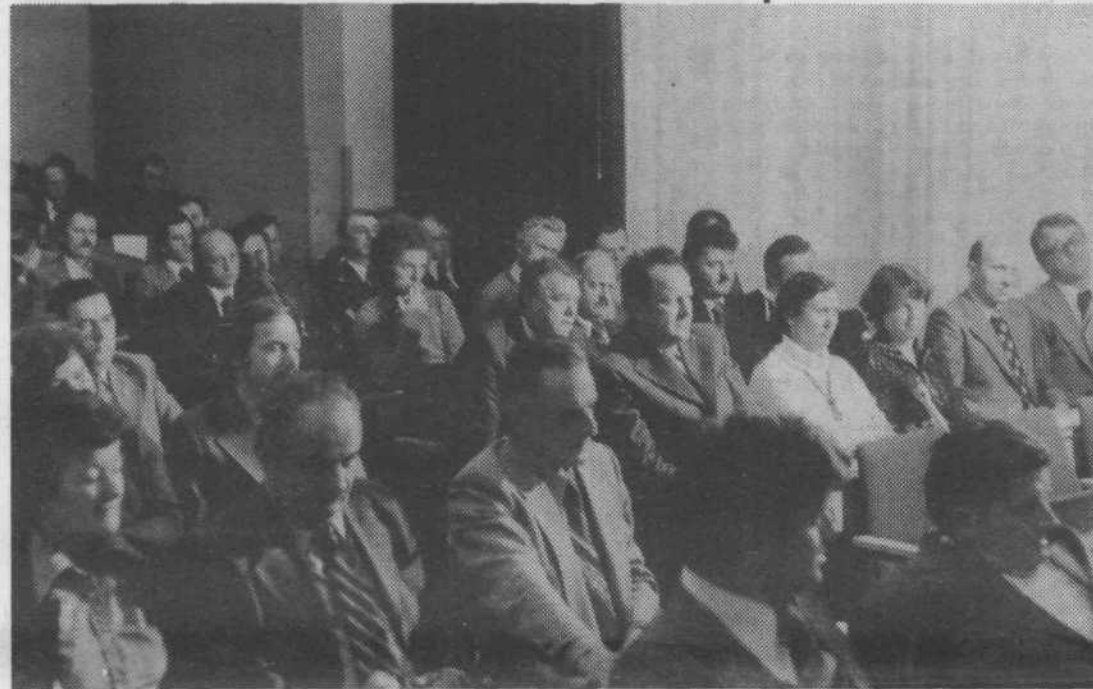
Besedilo AM

Prva skupna seja vseh treh zborov občinske skupščine drugega mandata. Skupna zasedanja bodo verjetno vse redkejša, problemi zahtevajo posamične obravnave na ločenih sejah.