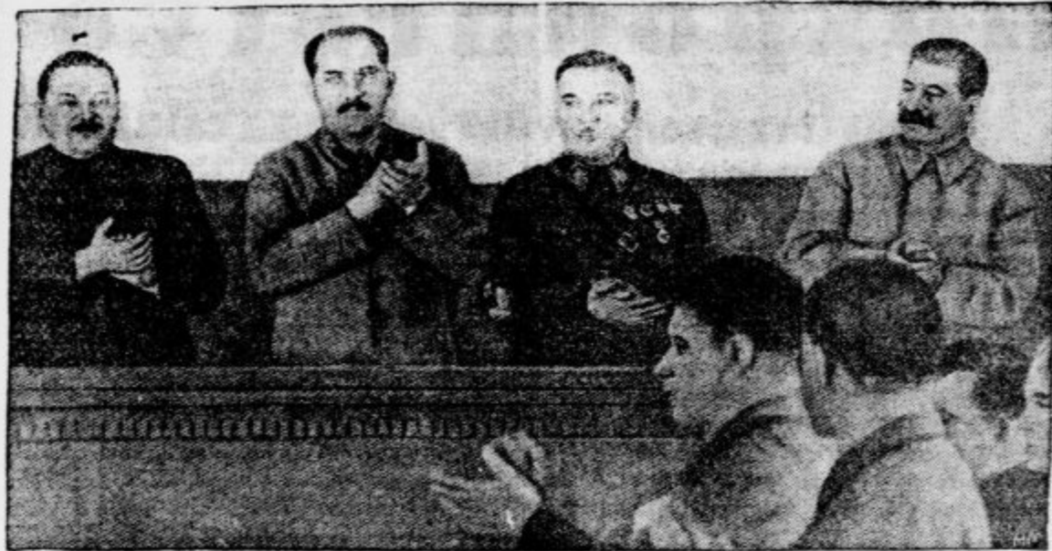
Štiri najvplivnejše osebnosti današnje Rusije. Od leve proti desni: Idanov, gubernor Leningrada, Kaganovič, maršal Vorošilov in Stalin