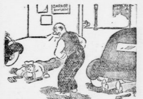
»Mamica lena! Voz, pod katerim delaš, je odrajal že pred dobre pol ure!« (»Everybodys weekly«)