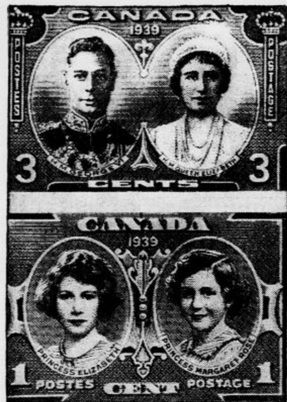
Posebne znamke, ki jih je dala natisniti pošta na prava za obisk angleškega kralja in kraljice v Kanadi. Zgoraj znamka s sliko Jurija VI. in kraljice Elizabete; spodaj znamka s sliko princeze Elizabete in Marije Rosé

Danes se bosta v Portsmouthu angleški kralj Jurij VI. in kraljica Elizabeta vkrcala na ladjo »Empress of Australia«, ki ju popelje na obisk v Kanado. V Portsmouthu se bosta od kralja in kraljice poslovili ob princesi, prestolonaslednici Elizabeta in njena sestra Marija Rosé, kraljica-mati Mary, Gloucesterski vojvoda s soprogo in Kentski vojvoda. V Portsmouthu bodo odhajajočemu kralju tudi na slovesen način izročili ključne odnotne trdnjave.