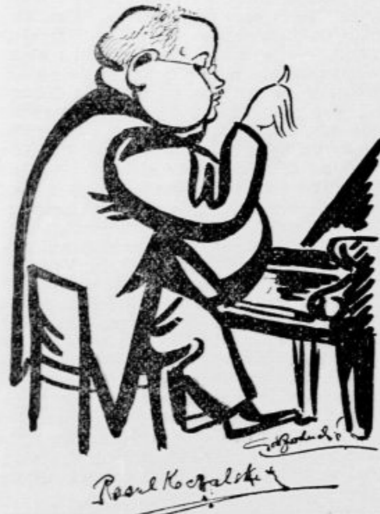
no publiko. Program je obsegal v prvem delu dve Chopinovi baladi in deset etud istega skladatelja, v drugem delu pa je očiten klavirski umetnik izvajal pet la-

Občinstvo je mojstra Koczalskega navdušeno pozdravljalo in se mu zahvaljevalo z burnim aplavzom. V seriji koncertov zadnjih mesecev je bil ta večer za mnoge prijatelje glasbe dogodek, ki jim ostane v hvaležnem spominu.