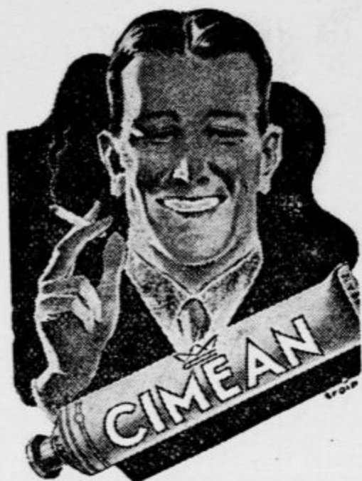
STRASTEN KADILEC IN VENDAR SO MI ZOBJE SNEZNOBELI — CIMEAN ZOBNA KREMA DELA ČUDA!