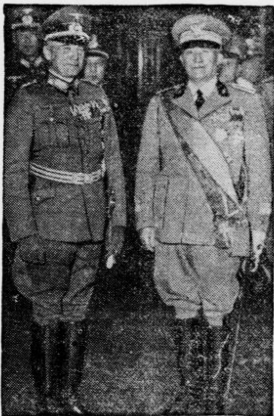
General von Brauchitsch (na levi) in general Pariani (na desni). Obisk šefa nemškega gen. štaba v Italiji zbuja v mednarodnem svetu razumljivo pozornost