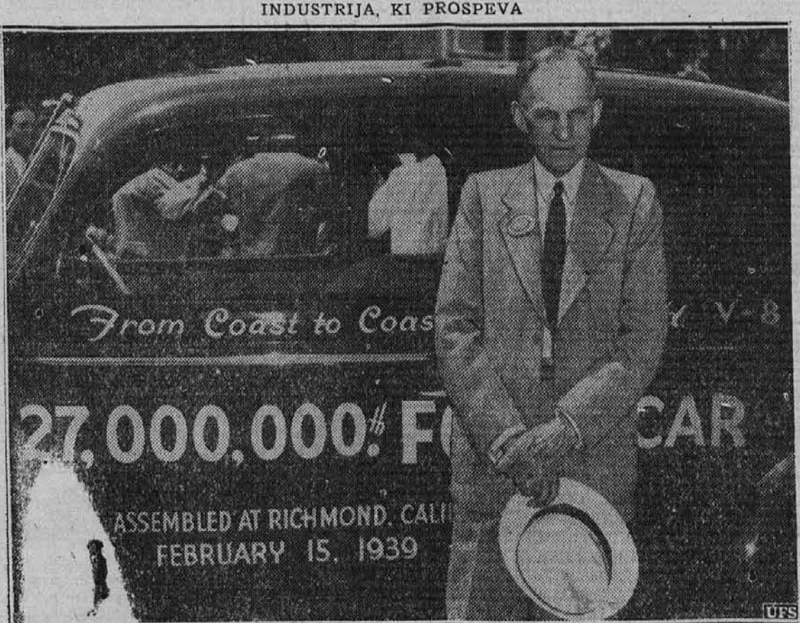
Fordove tovarne so letos postavile na trg 27 milijonski avto in na gornji sliki stoji industrijalec Henry Ford poleg tega znamenitega avtomobila, ki je bil najprej kazan na razstavi v San Franciscu in bil potem odpeljan še na newyorško razstavo. Fordova industrija je letos stara 36 let.

Neki dobavitelj mleka je zaradi neplačanih 150 dinarjev za mleko neki stranki v Mariboru dal zarubiti kolo. Prišla sta ga rubit z eksekutorjem. Doma sta našla mater in hčer, ki ju je prihod sodnega izvršitelja tako razburil, da sta pograbili za sekuro in tako kolo pred eksekutorjem na drobne kosce razbili.