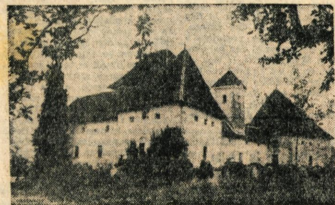
Gracarjev turn pred zadnjo vojno

»O, bilo je mnogo tega na podstrešju,« mi je rekla na dvajsetletna mlada žena, stola,