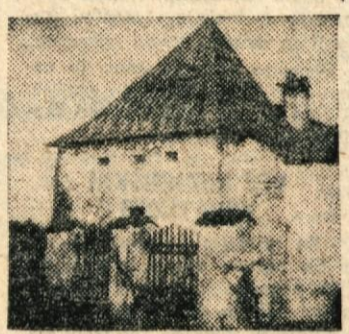
Eden izmed grajskih stolpov Gracarjevega turna med obnovo

Pa tudi doma odkrijejo prav tisti čas mostiščarje iz mlajše kamene dobe na Ljubljanskem barju, ilirske kovačnice na Važah in znamenito situo,