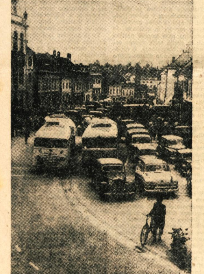
Fraznik soferjev so tudi novomeški in okoliški soferji lepo proslavili, o čemer so poročali prejšnji teden. Na sliki: pogled na Glavni trg, kjer so se ob proslavi razvrstila motorna vozila. Toliko jih že lep čas ni bilo na kupu. V zadnjih tednih se je posebno povečalo število motornih koles v mestu in okraju.

Dragotin Gregorc Naročajte in berite »DOLENJSKI LIST«!