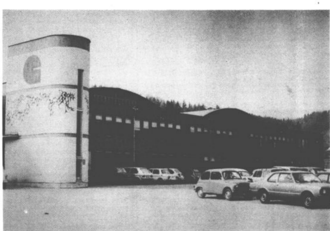
Tozd Gradbeni elementi TGO Gorenje je poleg Vegradovega kamnoloma edina delovna organizacija v krajevni skupnosti Gorenje.

jo, da jih na področju družbene samozadržne čaka še vrsta nalog, ki jih bo potrebno čimprej opraviti.