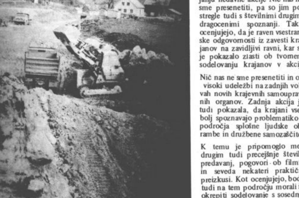
Na področju Gorenja urejajo zadnji odsek Saleške magistrale.

doma bo, kot predvideva predračun, veljalo 850.000 dinarjev. Pri zbiranju teh sredstev jim je že priskočila na pomoč tudi krajevna skupnost in upajo, da jim bodo pri nadaljnjih delih še pomagali. Posebej spodbuden