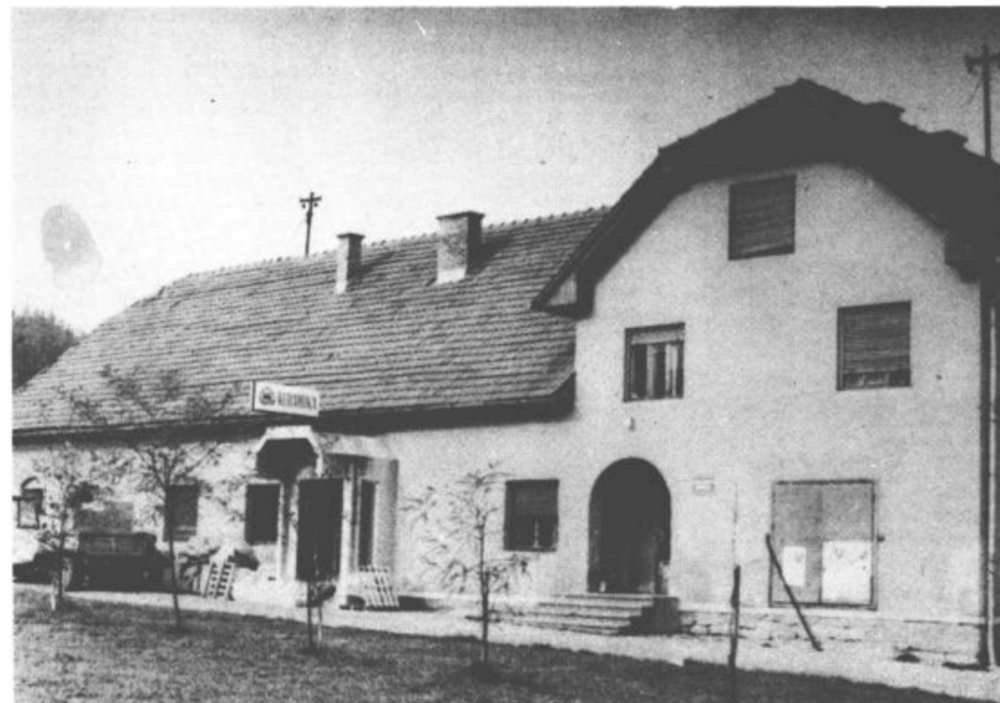
Z obnavljanjem zadržnega doma so se začeli in v preurejenih prostorih bodo organizacije in društva imela neprijetno boljše delovne pogoje.

Ko ob izteku planskega obdobja 1975-1980 ocenjujejo svojo delovno uspešnost povedo, da so si za ta čas sestavili zelo obsežen in pester delovni načrt, ki je tudi finančno precej zajeten. Za vse naloge, ki so si jih zastavili, naj bi porabili 5.000.000 dinarjev, od tega