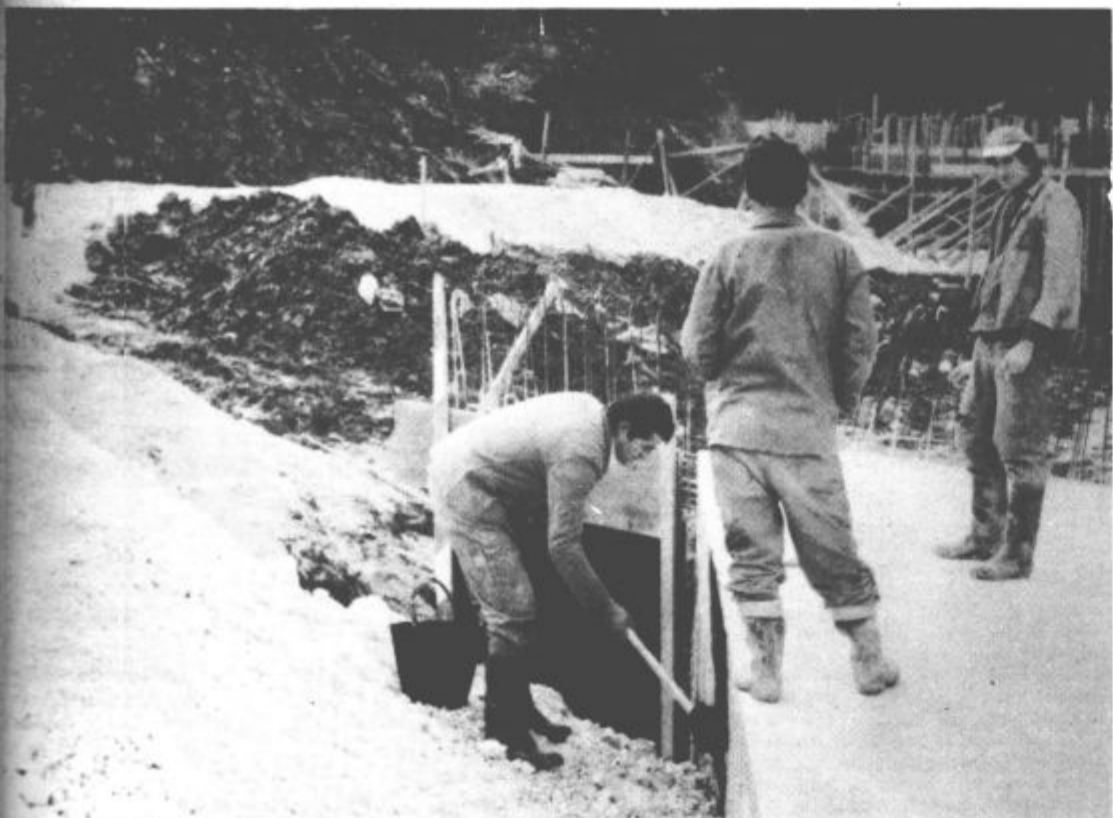
Gradnja Šaleške magistrale naglo napreduje. V teh dneh so pričeli izvajati del z gradnjo dveh mostičkov v ki bodo povezovali Šaleško magistralo s sedanjo cesto Velenje – Šoštanj. Opravili bodo vsa možna dela pri skladšču razstreliva, tako da bodo spomladi, ko bo skladšče prestavljeno, čim prej dokončno uredili cesto.

Na tekmovalju pa bodo s kulturnimi programi sodelovali tudi velenjski gimnazijci.